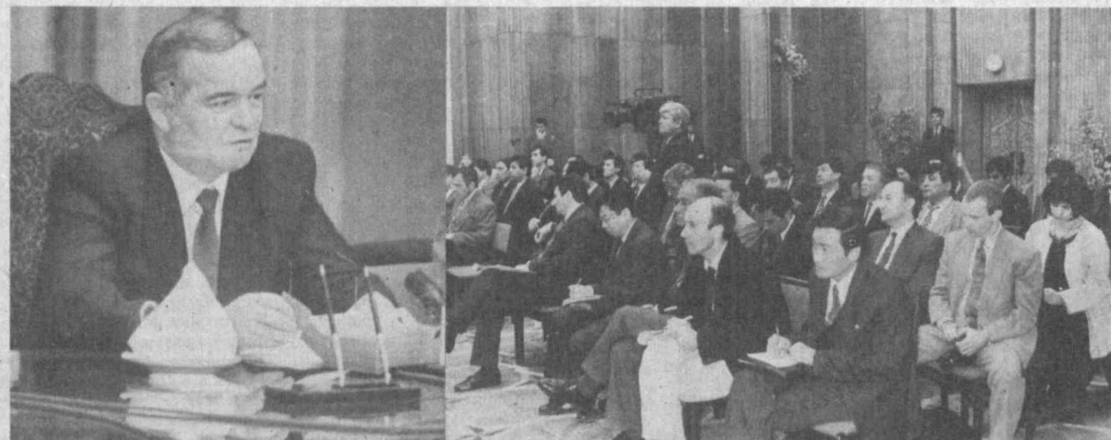
НА СНИМКАХ: во время пресс-конференции.

30 МАРТА ЧЕТВЕРГ № 62 (1072) 1995 год В розницу — свободная цена