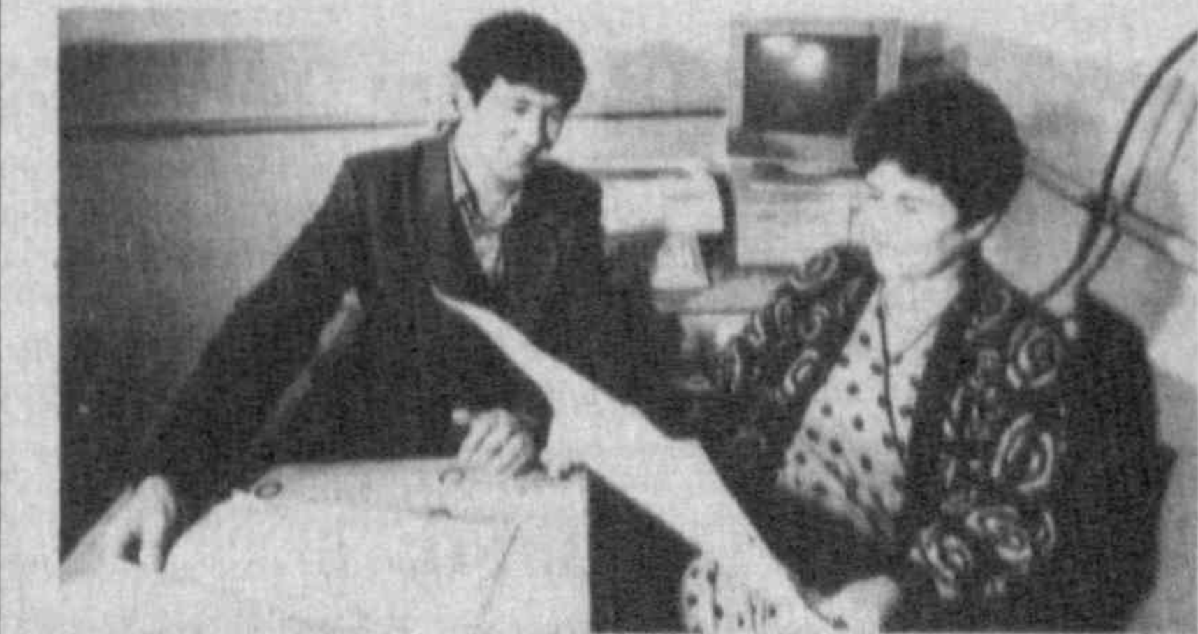
ПЛАНЫ И РЕАЛИИ АО «САЛОМАТЛИК» САМАРКАНДСКАЯ ОБЛАСТЬ. Всего несколько месяцев назад акционерный завод, специализирующийся на производстве масла, сыра, был выделен из государственного подчинения и приобрел статус акционерного общества «Саломатлик».

Еще в начале 70-х годов на территории Чимбайского района Каракалпакстана был выявлен источник горькой целебной воды. Специалисты НИИ имени Семашко после проведенных исследований она была рекомендована для лечения кожных заболеваний, болезней желудка, суставов и желчевыводящих путей.