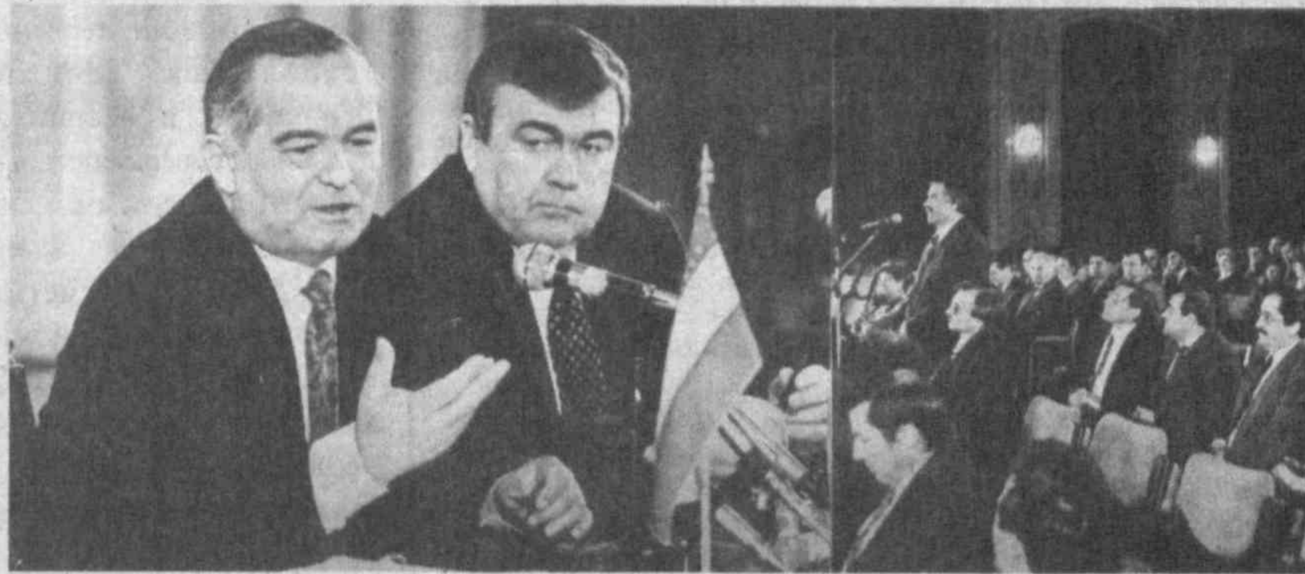
НА СНИМКАХ: во время встречи президентов И. КАРИМОВА и М. СНЕГУРА с руководителями отраслей, крупных предприятий и предпринимателями.

По приглашению Президента Молдовы Мирча Снегура Президент нашей республики Ислам Каримов с 30—31 марта посетил с официальным визитом эту страну.