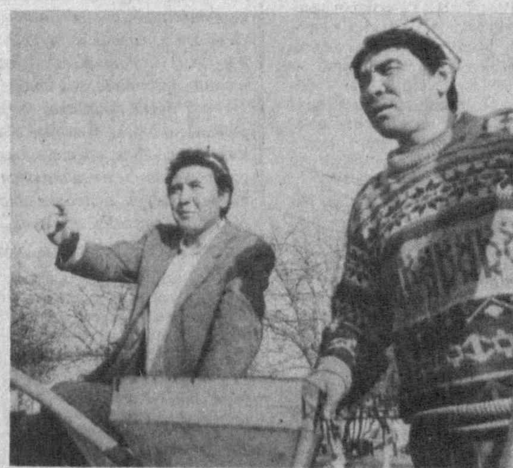
Началась посевная в опытном производственном хозяйстве имени Гафура Гуляма Шариф Рашидовского района Сырдарьинской области. В нынешнем году в хозяйстве отвели под хлопок 1.500 гектаров, под кукурузу — 40.