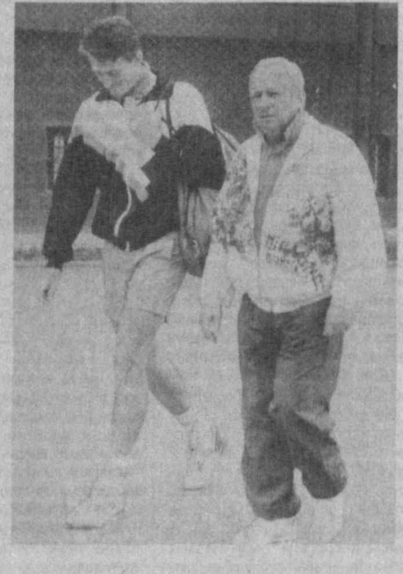
Соперник — самый сильный из тех, с кем они прежде встречались, и у команды Узбекистана очень хороший шанс пробиться в первую группу.