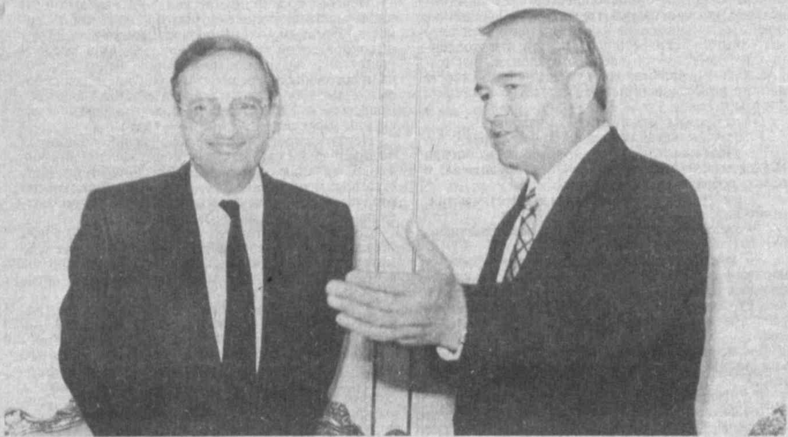
НА СНИМКЕ: во время приема.

Президент Узбекистана Ислам Каримов 10 апреля принял Чрезвычайного и Полномочного Посла Федеративной Республики Германия в нашей стране Карла-Хайнца Куна по его просьбе.