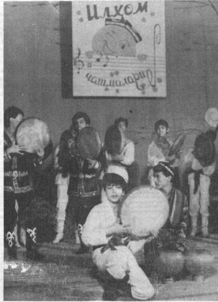
Пойтахтнинг Яққасарой ли шаҳар кўрик-танловларида бир неча бор қатнашган «Истеъдод чашмалари» доирасида ташкил қўлган киритган. СУРАТДА: ансамбль иштирокчилари.