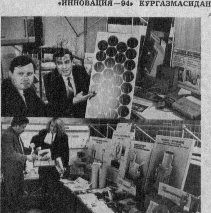
СУРАТДА: кўрғазма залидан лавҳалар.

Ўзбекистон республикаси Фан ва техника давлат комитетида илмий-техник лойиҳалар танлов асосида ва инновация фаолияти бўйича яратилган янги техника, илгор технологиялар, курилиш ашёлари, халқ хўжалигининг турли соҳаларида фойдаланишга мўлжалланган асбоб-ускуналар ҳамда компьютерлаштирилган тизимлар «Инновация—94» кўрғазмаси намойиш этилди. Қарий 70 та илмий муассасаларда яратилган 280 га яқин экспонатлар кўрғазмаси илмий-техник лойиҳалар билан илгор техника ва технологияларнинг ўзига хос бозори деган таассурот уйғотди. Бу белиз эмас. Кўрғазмада расмий таъриф қилинганлардан ташқари вазириллар, илмий муассасалар, илмий-техник марказлар, ўз ишлаб чиқаришини фан ютуқ-