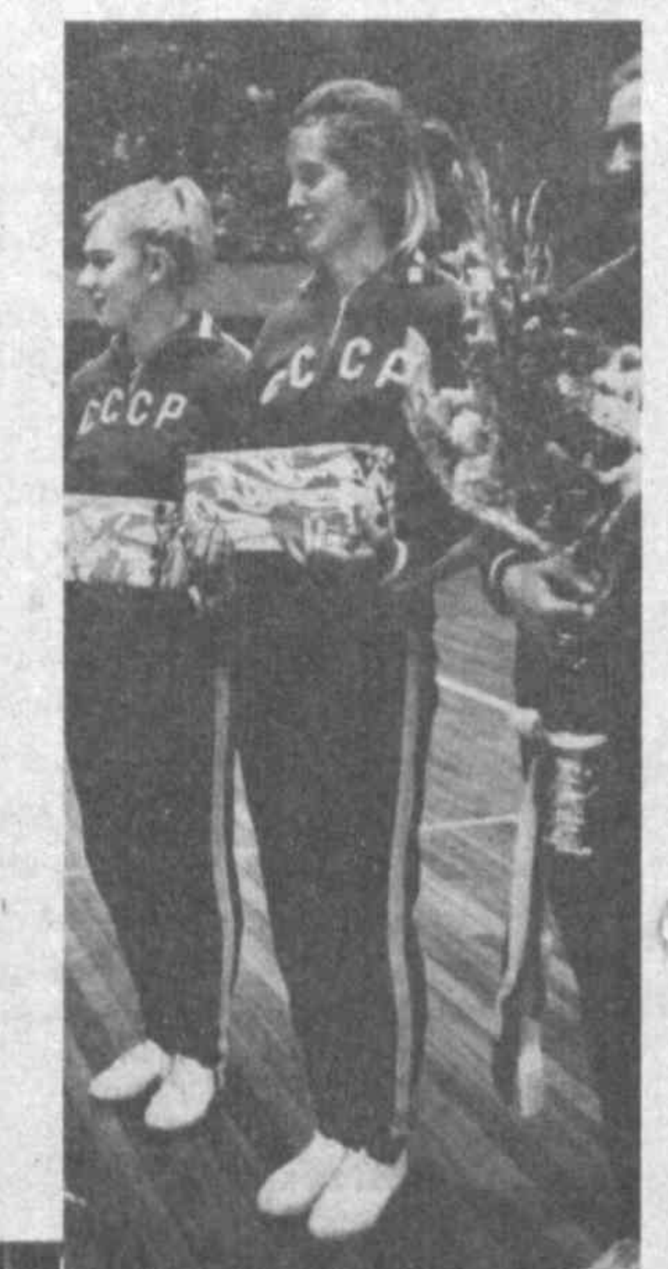
мобилист», многие годы успешно выступавшей в высшей лиге всесоюзного чемпионата.