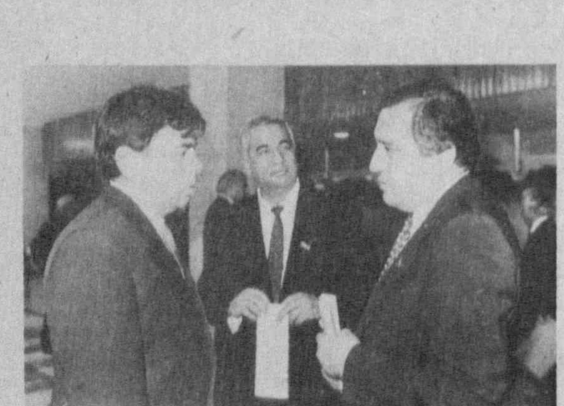
В перерыве между заседаниями.