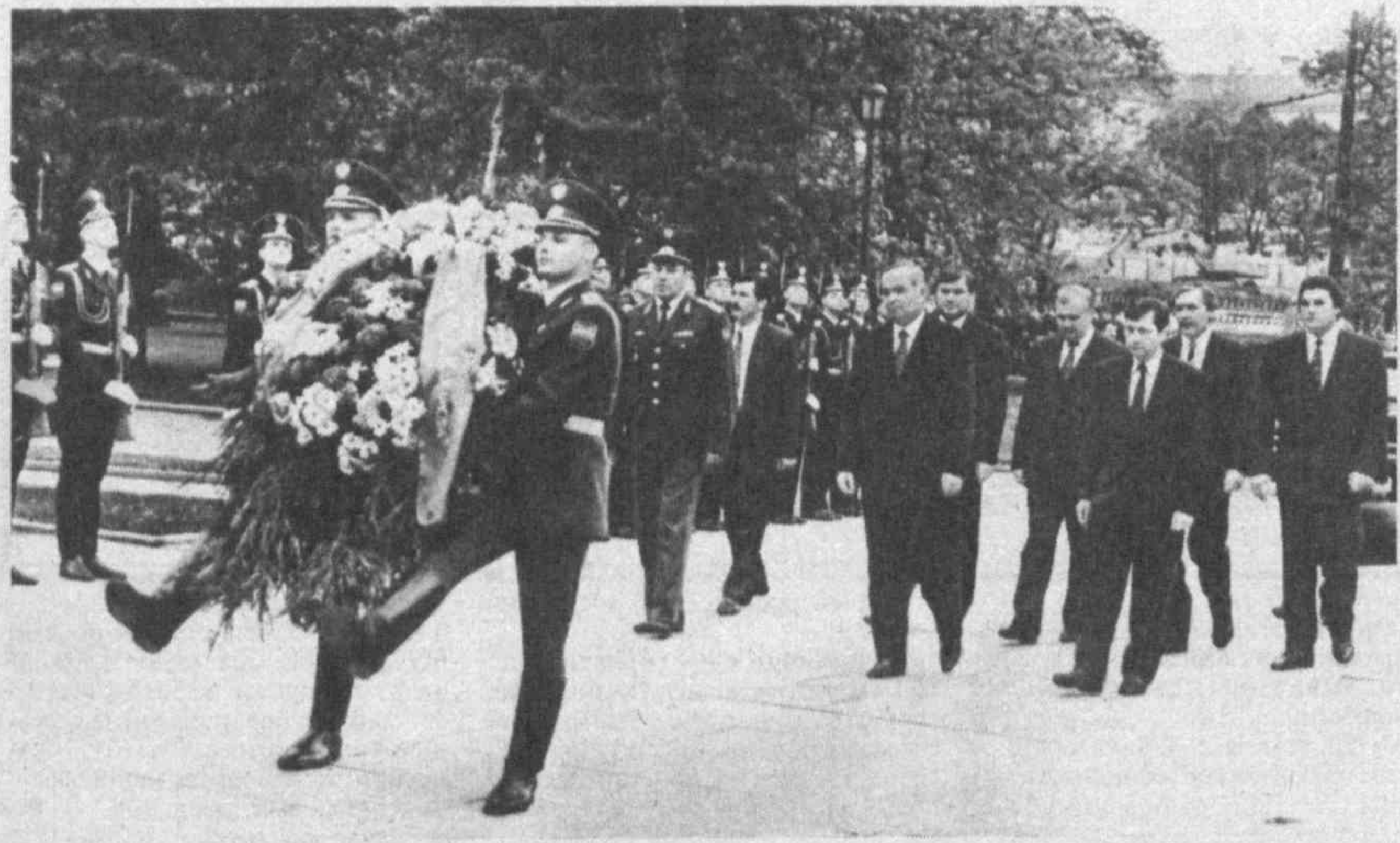
НА СНИМКЕ: возложение венка к могиле Неизвестного солдата.

Президент Республики Узбекистан Ислам Каримов в тот же день возложил венок к могиле Неизвестного солдата на Красной площади, почтил память погибших. На фронтах второй мировой войны отдал свою жизнь более 400 тысяч узбекистанцев. Всего за годы войны из Узбекистана ушли на фронт 1 миллион 400 тысяч наших соотечественников. Как подчеркнул перед отъездом в Москву Ислам Каримов, благодарная память о погибших на войне наших