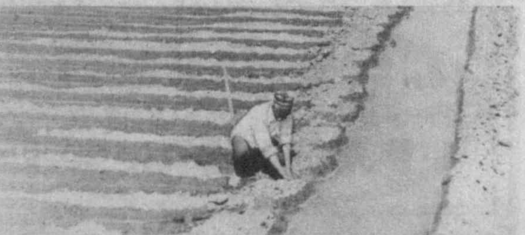
В коллективном хозяйстве «Деконбол» Касансайского района Наманганской области в этом году отведен под хлопчатник 800 гектаров. С каждого планируется получить по 30 центнеров сырья. В эти дни на полях идет полив.