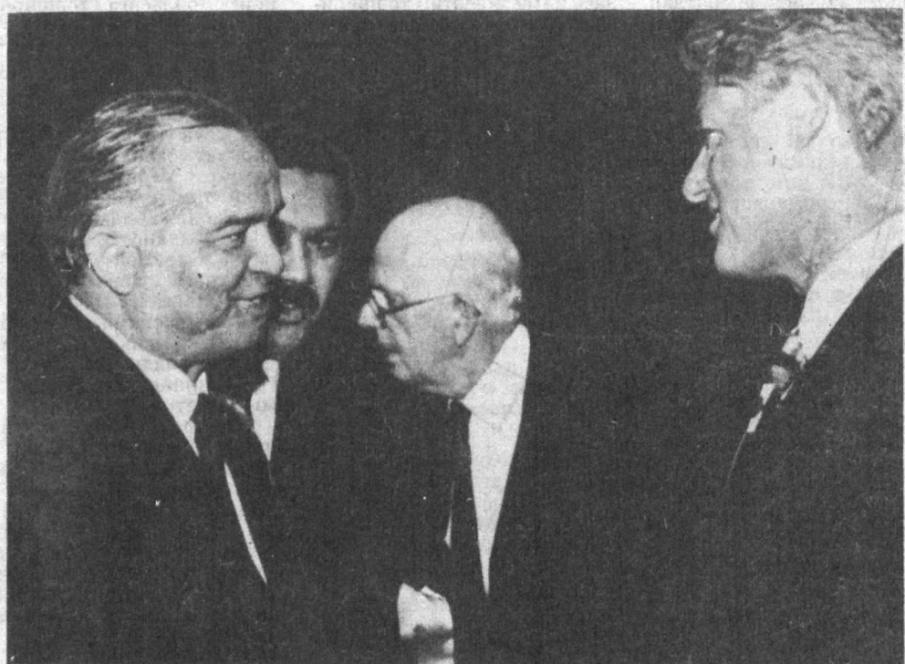
В Президент Каримов with with Bill Clinton

Америка Президенти Билл Клинтоннинг Президентимизга йўллаган бир неча телеграммасини ўқигансиз, албатта. Энди мана бу дастхат битилган сурат: «Президент Каримовга энг эзгу тилаклар ила, Билл Клинтон».