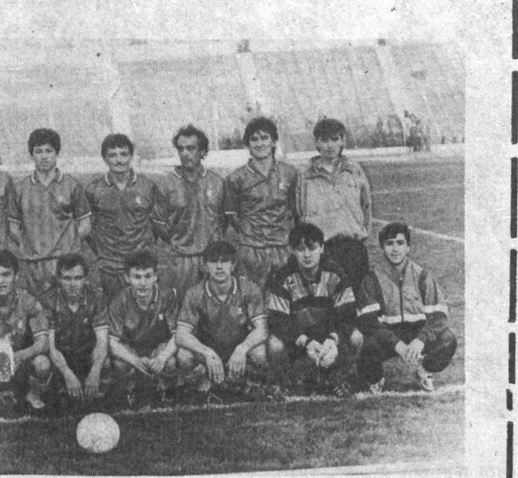
Вилот спорт қўмитасининг алоҳида жорий ҳисобига келиб тушган. Менинг ўйимдан-ўйингача вақтим машғулот майдонига эмас...