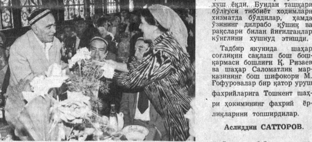
далар қўшиқлари, кулгу устаси Ҳожибой Тожибоевнинг ичак узди ҳангомаларини фахрийларнинг кайфиятини

Тошкент шаҳар Соғлиқни сақлаш бошқармасининг шаҳар саломатлик маркази Ғалабаини 49 йиллигини зўр тантана билан нишонлади. Тадбирга Собир Раҳимов туманидаги Уруш ва меҳнат фахрийлари тақдир қилинди. Байрам тантанасида шифокорларнинг халқимиз саломатлигини таъминлаш борасида олиб бораётган ибратли ишлари ҳусусида ҳам сўз юритилди. Байрам дастурхонини турли хил ноз-неъматлару ширинликлар билан салқин ичимликлар билан безатилган. Ўзбекистон халқ артисти Нуриддин Ҳамрокулов, Олимжон Орифжонов, Нуриддин Ҳайдаров каби хушовоз хона-