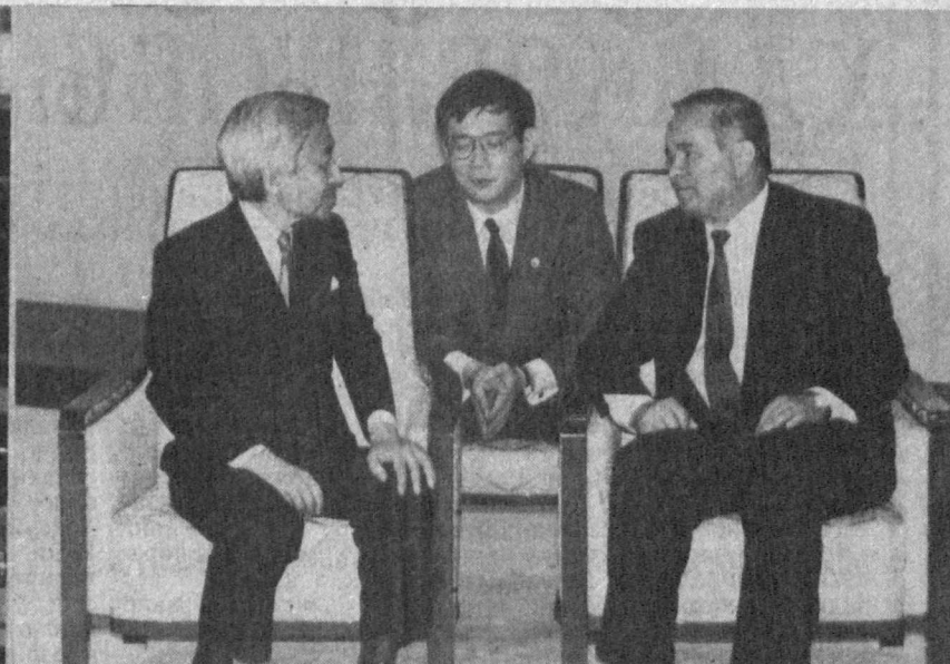
Республикаимиз раҳбари Япония императори Акихито билан учрашди.