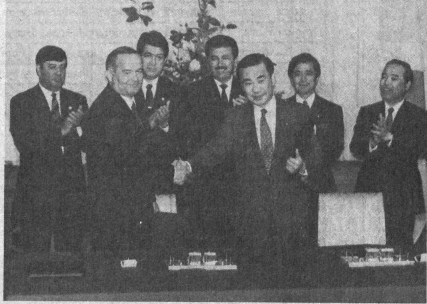
Ўзбекистон Республикаси Президенти Ислам Каримовнинг Япония Бош вазир Цутому Хата билан учрашуви пайти.