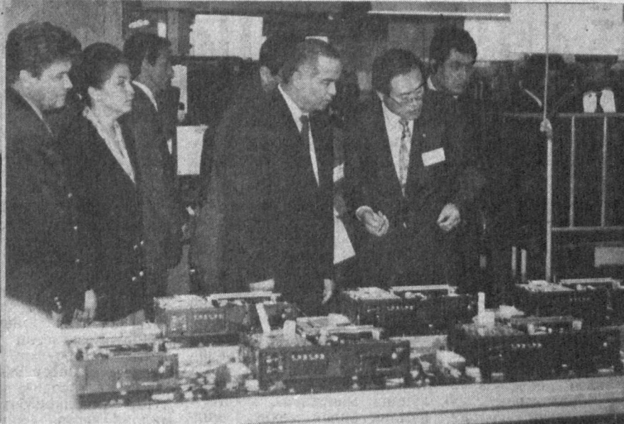
Мамлакатимиз расмий делегацияси Япониянинг «Мацусита» корхонасида ҳам бўлди.