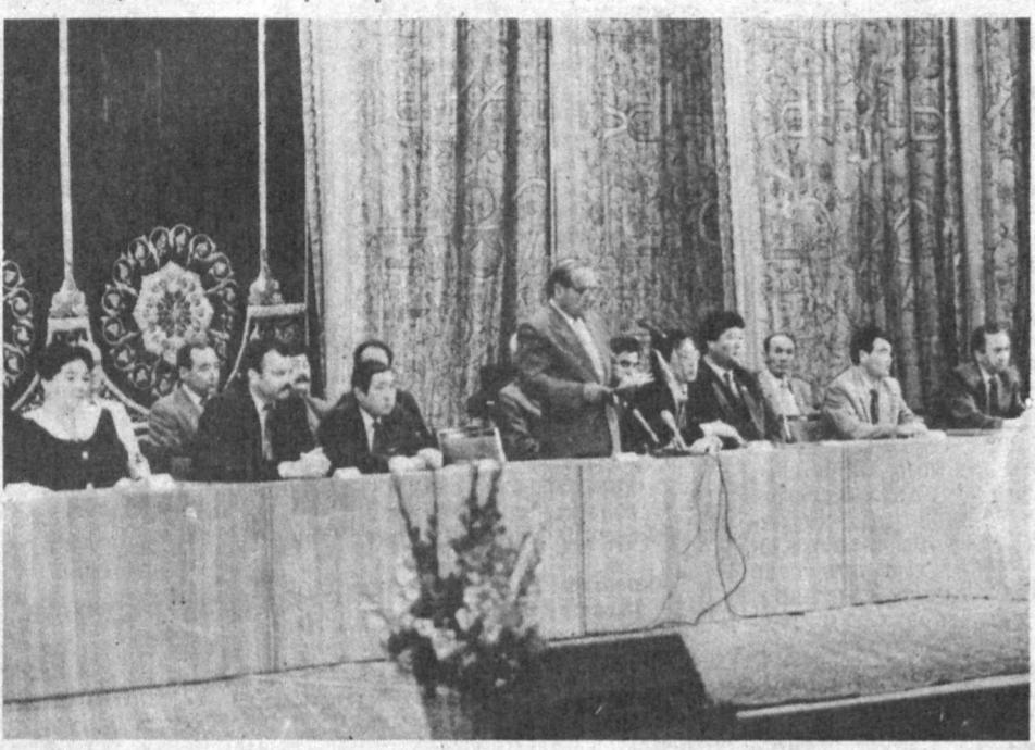
СУРАТДА: Ўзбекистонда Қозоғистон кунлари ёпилиш маросимидан лавҳалар.