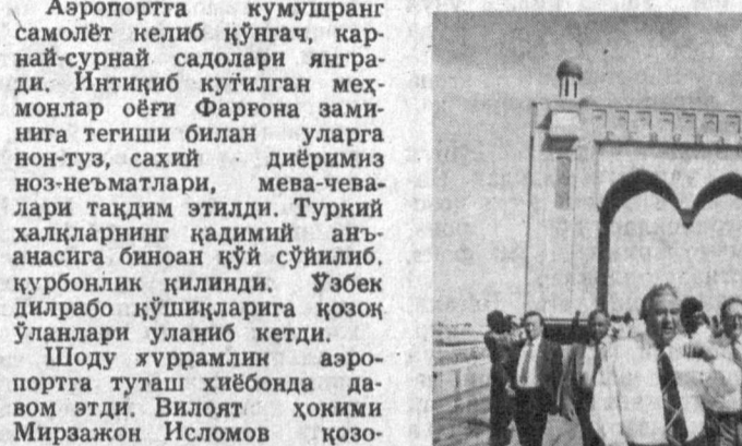
Аэропортга кумушранг самолёт келиб қўнғач, карнай-сурнай садолари янгради.

Дилбар Фаргона сўнгги йиллар ичда бу қадар тантана, шод-хуррамлик, файзу нафосатини кўрмаган эди.