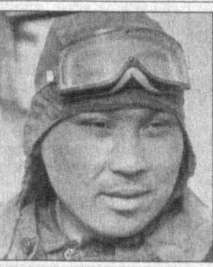
Четко по графику ведут подготовку семян к закладке нового урожая работники хлопкоочистительного завода "Музрабад".

Скоро в нашей стране будет отмечаться еще одна знаменательная дата — 557-летие со дня рождения великого узбекского поэта и мыслителя Алишера Навои. Как и прежде, день рождения поэта будет широко отмечаться. Институт литературы Академии наук Узбекистана подготовил к выпуску сборник научных статей "Поэтика произведений Навои". Вышел в свет 13-й том полного собрания сочинений великого мыслителя.