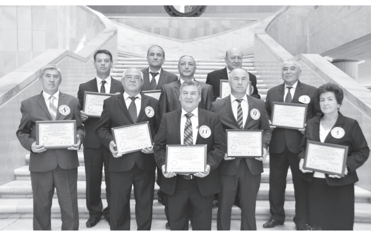
Участники Ташкентского городского этапа смотра-конкурса.