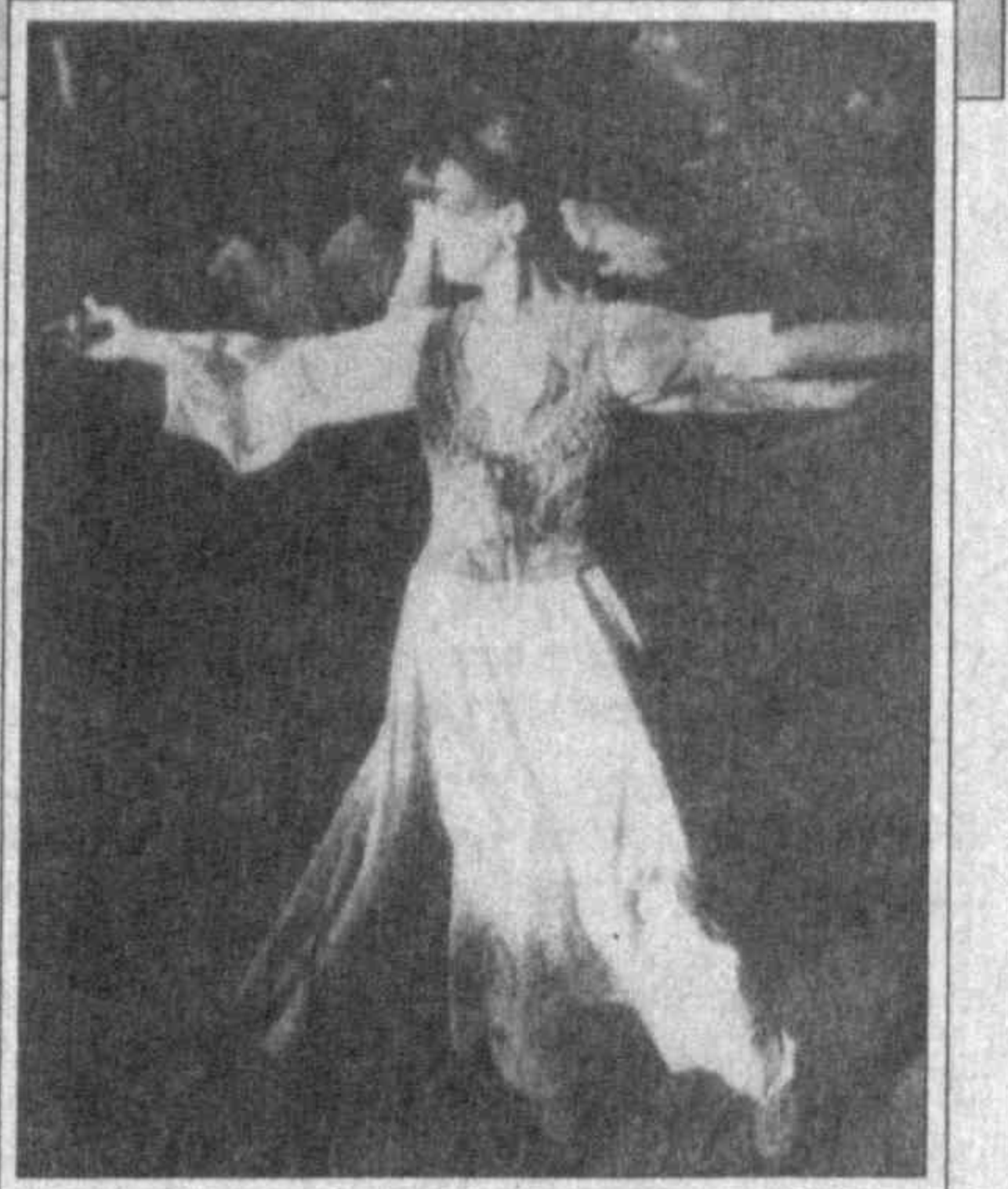
НА СНИМКАХ: во время празднования Навруза в Ташкенте.

В Узбекистане Навруз по праву стал общенародным праздником, символом духовного обновления народа.