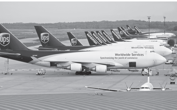
Хориж матбуоти хабарлари асосида тайёрланди.

Кибержиноятчилар 100 мингдан ортиқ пул ўтказмалари ҳақидаги маълумотларга эга бўлишган. Хакерлар жорий йилнинг 20 январидан 11 августгача бўлган муддат мобайнида «UPS» хизматидан фойдаланган мижозларга тегишли электрон манзиллар ҳамда уларнинг банклардаги ҳисоб рақамларини қўлга киритгани тахмин қилинмоқда.