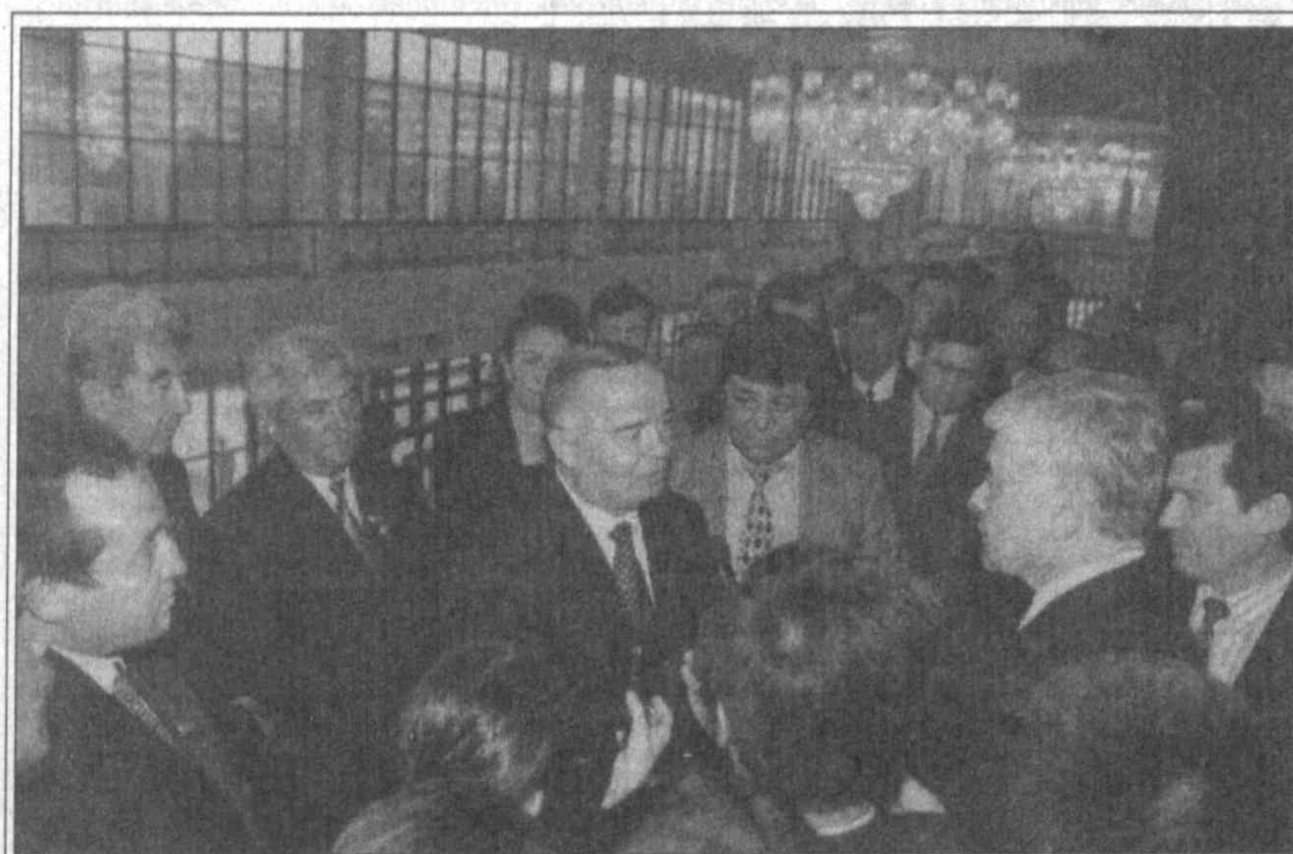
НА СНИМКАХ: Президент И. А. Каримов беседует с депутатами Олий Мажлиса и аккредитованными на сессии парламента журналистами; в зале заседания.

2 МАЯ • СУББОТА № 87 (1871) • 1998 год В розницу — свободная цена