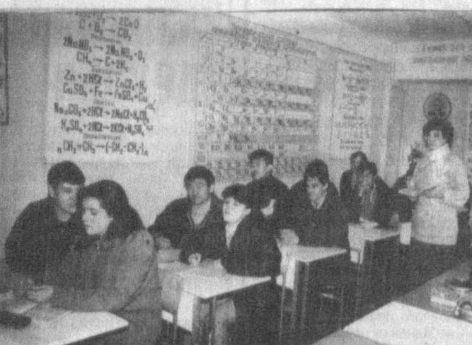
Шинист мостового крана - строитель и т.д.

Дальнейшая наша беседа с директором профшколы действительно убедила меня в правоте его заявления о нестандартности условий молодежи, обучающейся в стенах этого заведения.