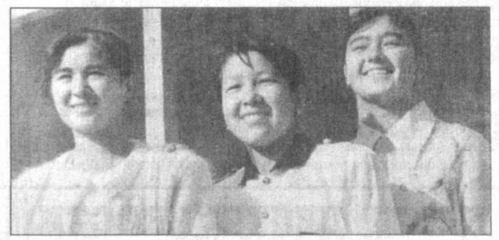
НА СНИМКЕ: общий вид здания новой общеобразовательной школы кишлака Кораянток; лучше ученицы школы. Ферганская область.

В Ферганской области большое внимание уделяется Национальной программе по подготовке кадров, хорошо понимая, что и в сельской школе можно подготовить духовно, творчески развитых специалистов. Не забывают об этом и в кишлаке Кораянток кооперативного союза "Намуна" Беширлыкского района. Строители ПМК-90 сдали "под ключ" новое здание школы, рассчитанной на 504 ученических места. Учащиеся здесь созданы все необходимые условия для практических занятий в учебных кабинетах. При школе сооружен большой спортивный зал, где ребята смогут заниматься спортом, имеются все тепличное хозяйство и уютная столовая.