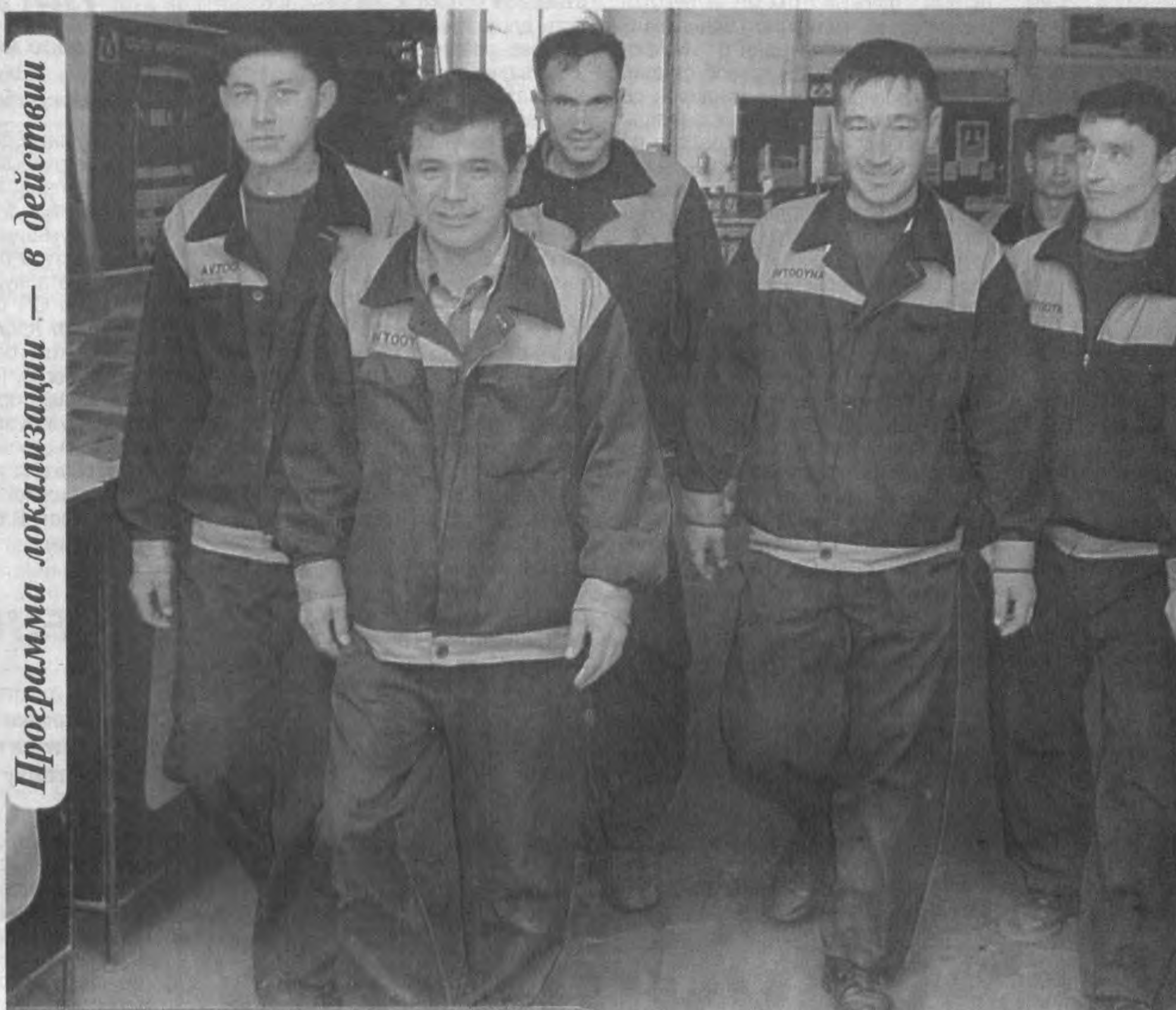
Программа локализации — в действии

Действующее в Фергане открытое акционерное общество «Автоойна» занимает важное место в автомобилестроительной отрасли нашей страны.