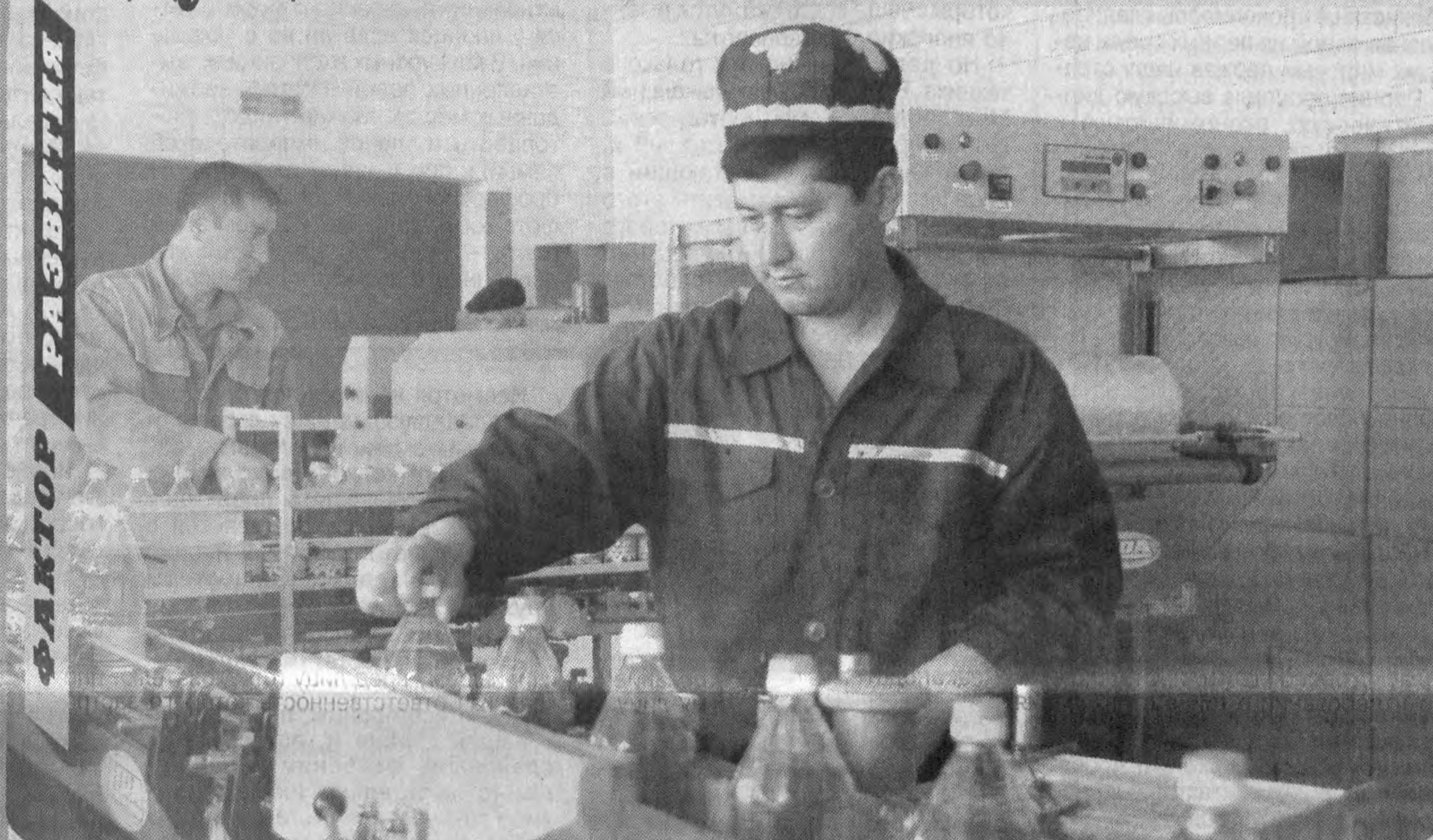
Действующее в Касанском районе узбекско-американское совместное предприятие «Косонегэкстракция» занимает достойное место в экономике нашей республики.

В прошедшем году на предприятии, оснащённом современным оборудованием, была переработана 108 631 тонна семян хлопчатника и 6 740 тонн завезенного из Украины соевого зерна, произведено 17 689 тонн хлопкового масла и 1 071 тонна соевого масла.