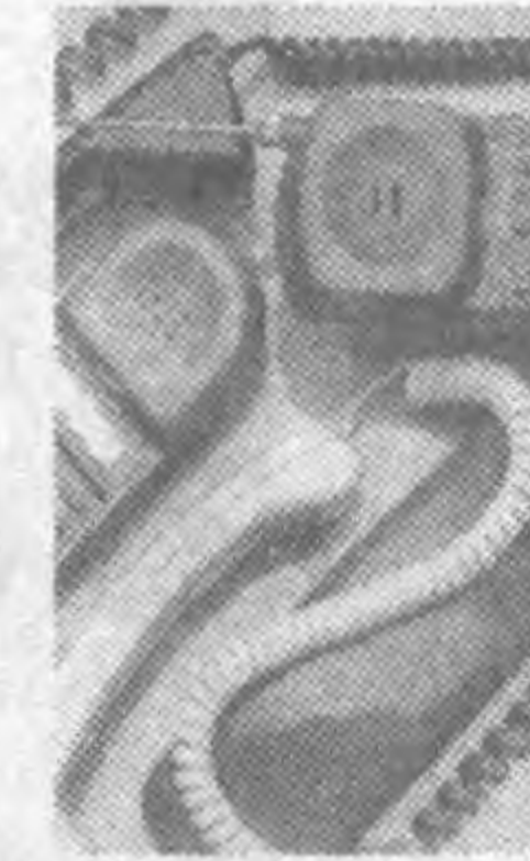
На снимке: во время встречи.

Официальный визит Президента Республики Узбекистан Ислама Каримова в Республику Казахстан продолжается.