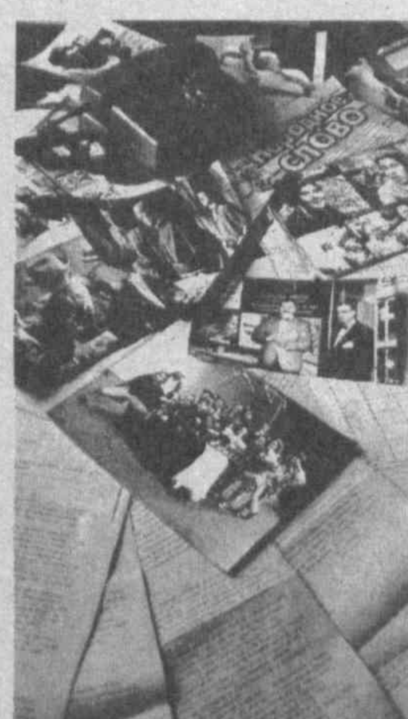
Узбекистан всегда был одним из самых «пишущих» и «читающих» государств. И это реноме он не утрачивал никогда. Только за последние четыре

года в республике резко возрос выпуск периодических изданий. И если в 1991 году выходило около двухсот газет и журналов, то сегодня здесь их издается около четырехсот пятидесяти. Из них 384 газеты, пятьдесят восемь — городская, сто шестьдесят четыре — районных и семьдесят две — многотиражных. Кроме того, в республике выходит 66 журналов, и из них пятьдесят шесть республиканских. Общеразовый тираж составляет около двух миллионов. Газеты и журналы издаются на двенадцати языках. Несмотря на финансовые проблемы, за описываемый период не закрылась ни одна газета. За последние четыре года по средствам массовой информации было выпущено пять указов Президента республики, касающихся предоставления льгот и повышения зарплат работникам печати. Только в Узбекистане из всех стран СНГ существует фонд поддержки печати. Помимо того, ежегодно выделяются значительные валютные средства пра-