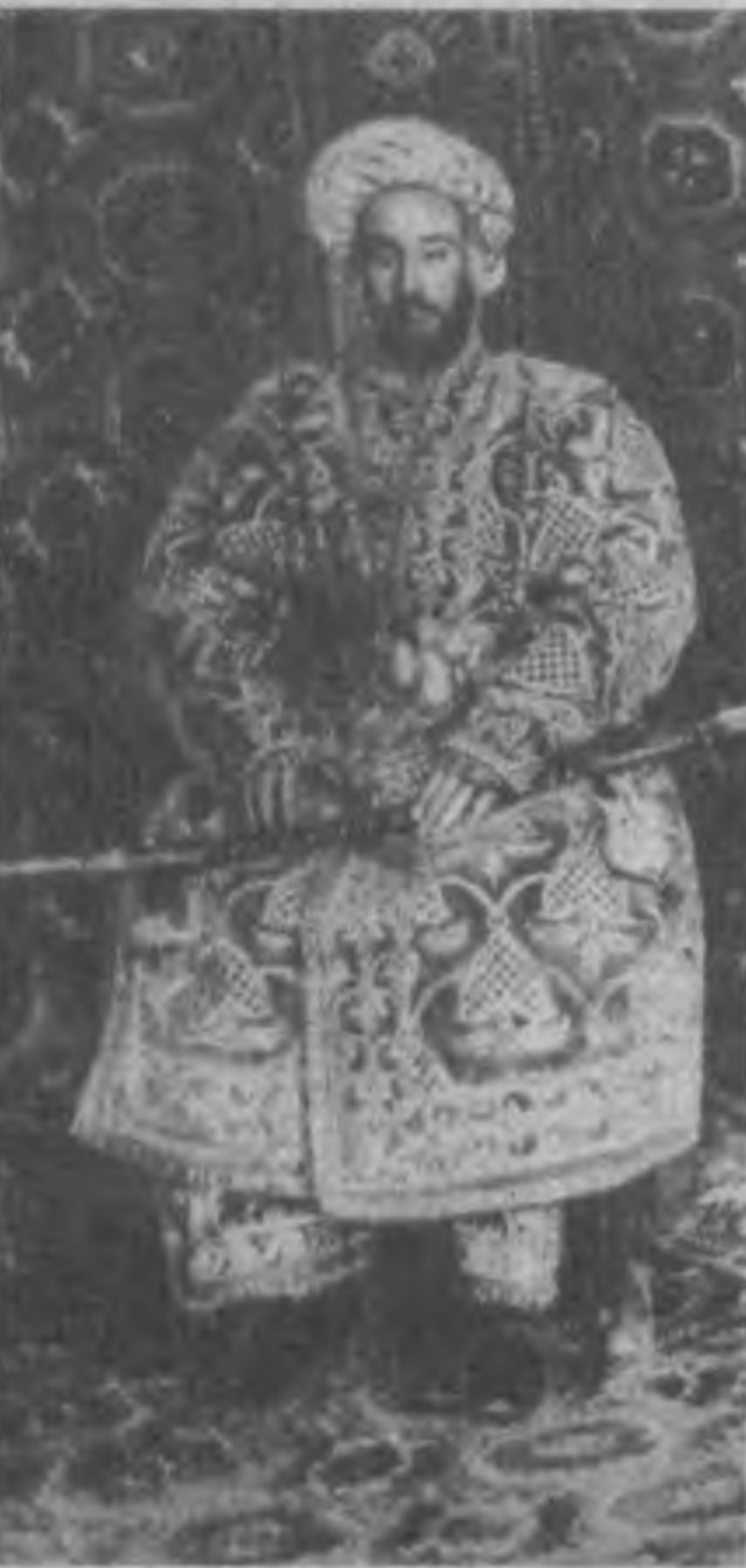
Старые фотографии обладают особой притягательностью. В них таится немало очарования прошлых лет. Но снимки, представленные на

выставке в Музее истории Академии наук Республики Узбекистан, несут еще и научную ценность.