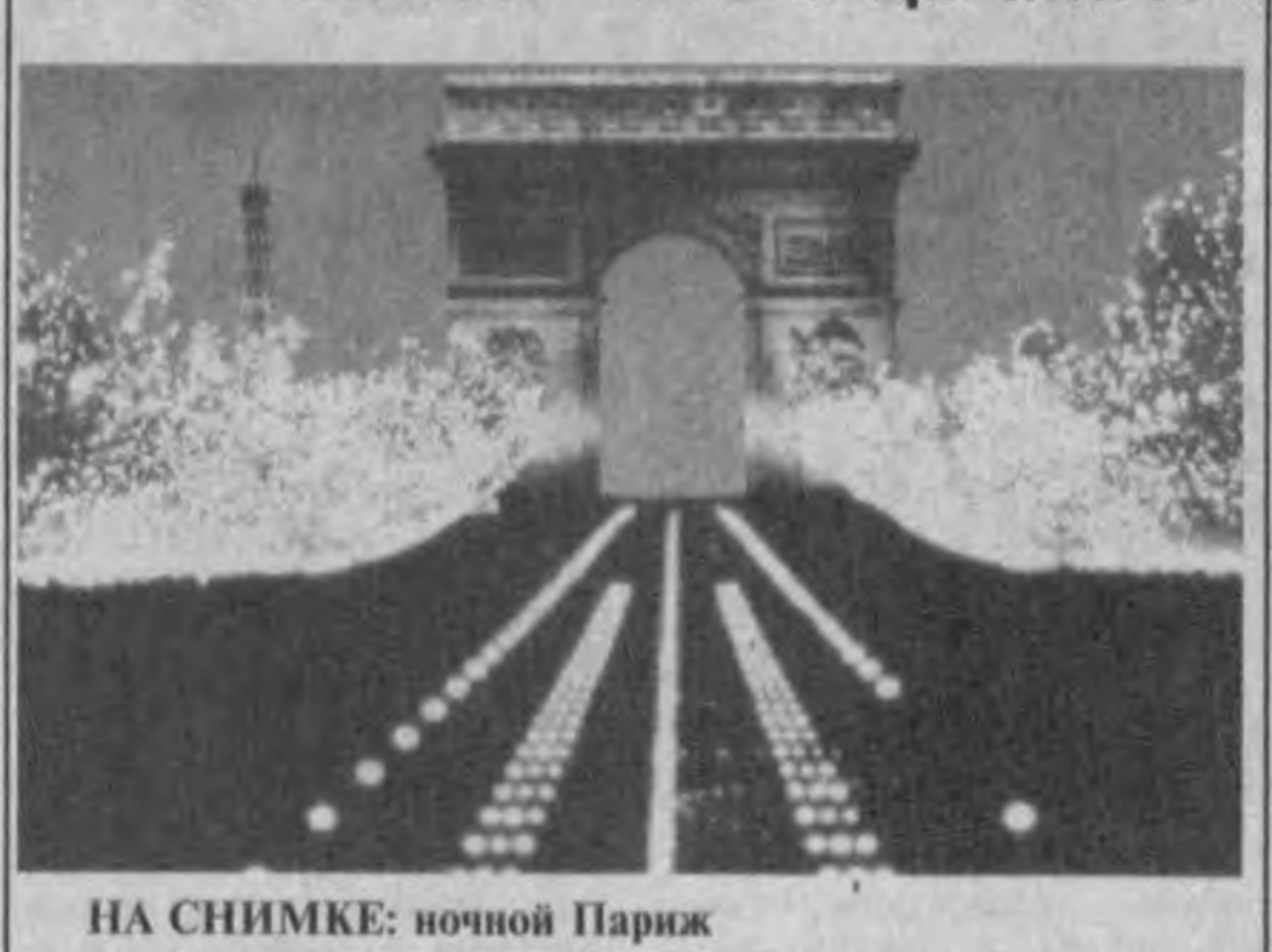
НА СНИМКЕ: ночной Париж