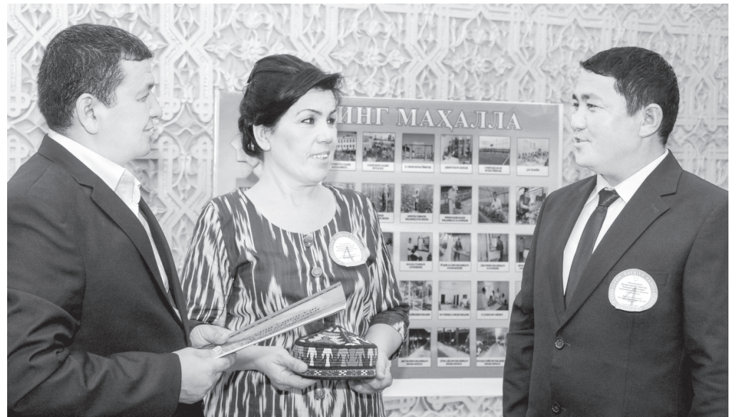
Участники Сурхандарьинского областного этапа смотра-конкурса.

В их презентациях отражена большая социальная работа в махаллях, направленная на укрепление духовно-нравственной атмосферы в семьях, повышение уровня и качества жизни людей. На вопросы