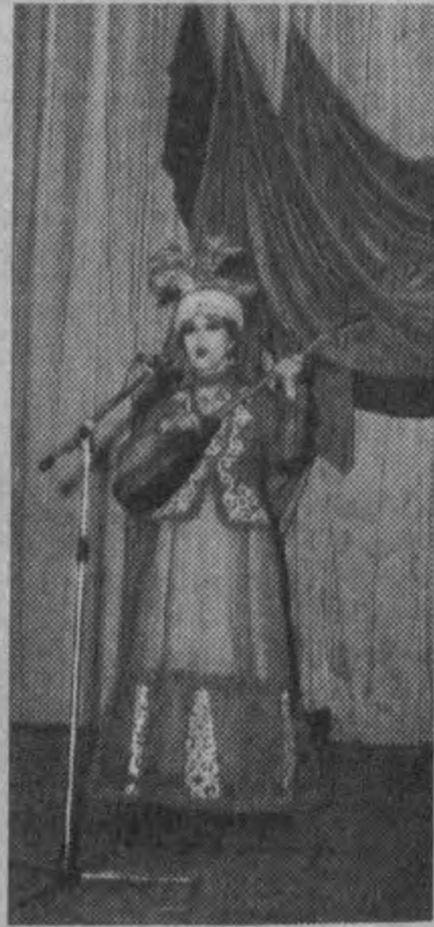
Атр музыкальной драмы в городе Джетысае, ныне носящий имя Курманбека-ага Жандарбекова.

Совместно с СГД, Союзом писателей Узбекистана и творческими объединениями Казахстана и Кыргызстана «Перизат» регулярно проводит встречи с учеными, писателями, поэтами, организует культурные мероприятия с участием артистов, музыкантов, фольклорных ансамблей. Начинает действовать фонд Казахского театра Узбекистана. В Союзе