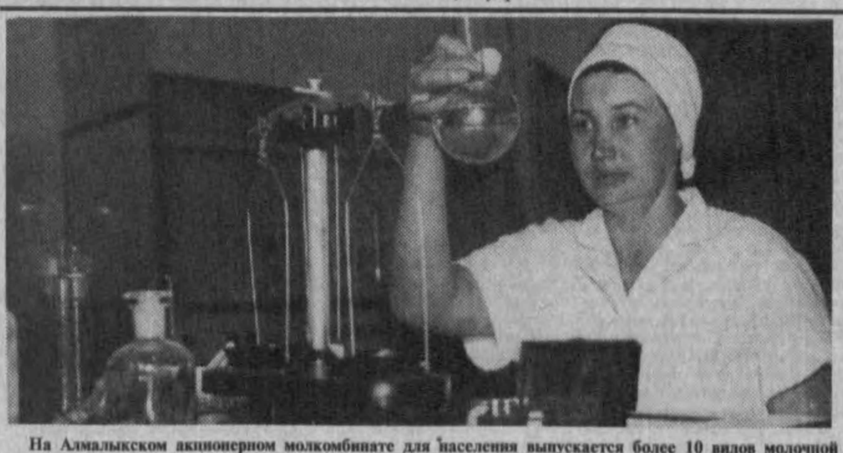
На Алмалыкском акционерном молочнокомбинате для населения выпускается более 10 видов молочной продукции. Недавно на нем налажен выпуск молочных изделий с добавками из фруктовых соков.

звонит у посетителя ярмарки и ванны, раковины, а также другая сантехника, изготовленная на ахангаранском «Сантехлите». Облицовочная плитка, разноцветный кафель, цемент — чего только здесь нет! — Мы думаем, — говорит председатель правления УзРТСБ Ш. М. Мухамедов, — что результаты последуют буквально с первых часов работы ярмарки, сделки будут заключены, и немало. На будущее же (уже в сентябре) мы планируем провести подобную выставку-продажу и открытые биржевые торги по реализации электронно-приборной и кабельной продукции. До конца года Узбекская республиканская товарно-сырьевая биржа рассчитывает также организовать подобные ярмарки по реализации текстильной, легкой, коммунально-бытовой, машиностроительной продукции. М. ЯДГАРОВ.