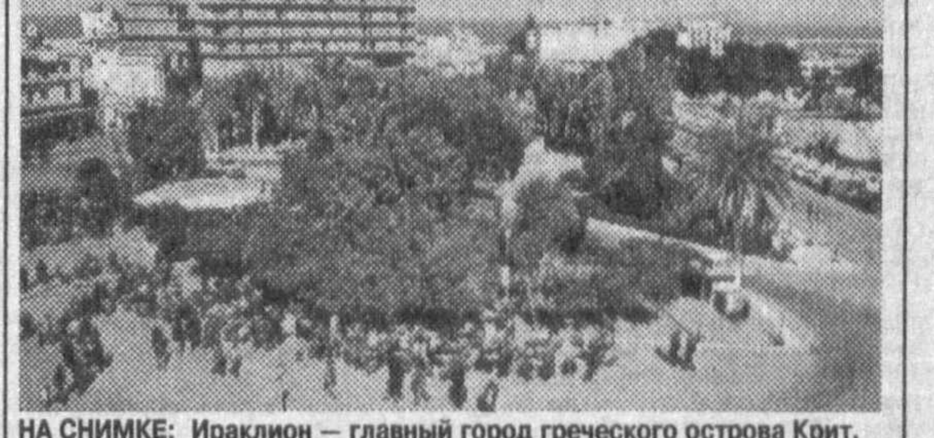
НА СНИМКЕ: Ираклион — главный город греческого острова Крит.

ЛОТЕРЕЯ СТАЛА ПОПУЛЯРНОЙ РИМ. В 1995 году итальянцы потратили 90 тысяч лир в среднем на человека для того, чтобы играть в популярную лотерею «Лотто».