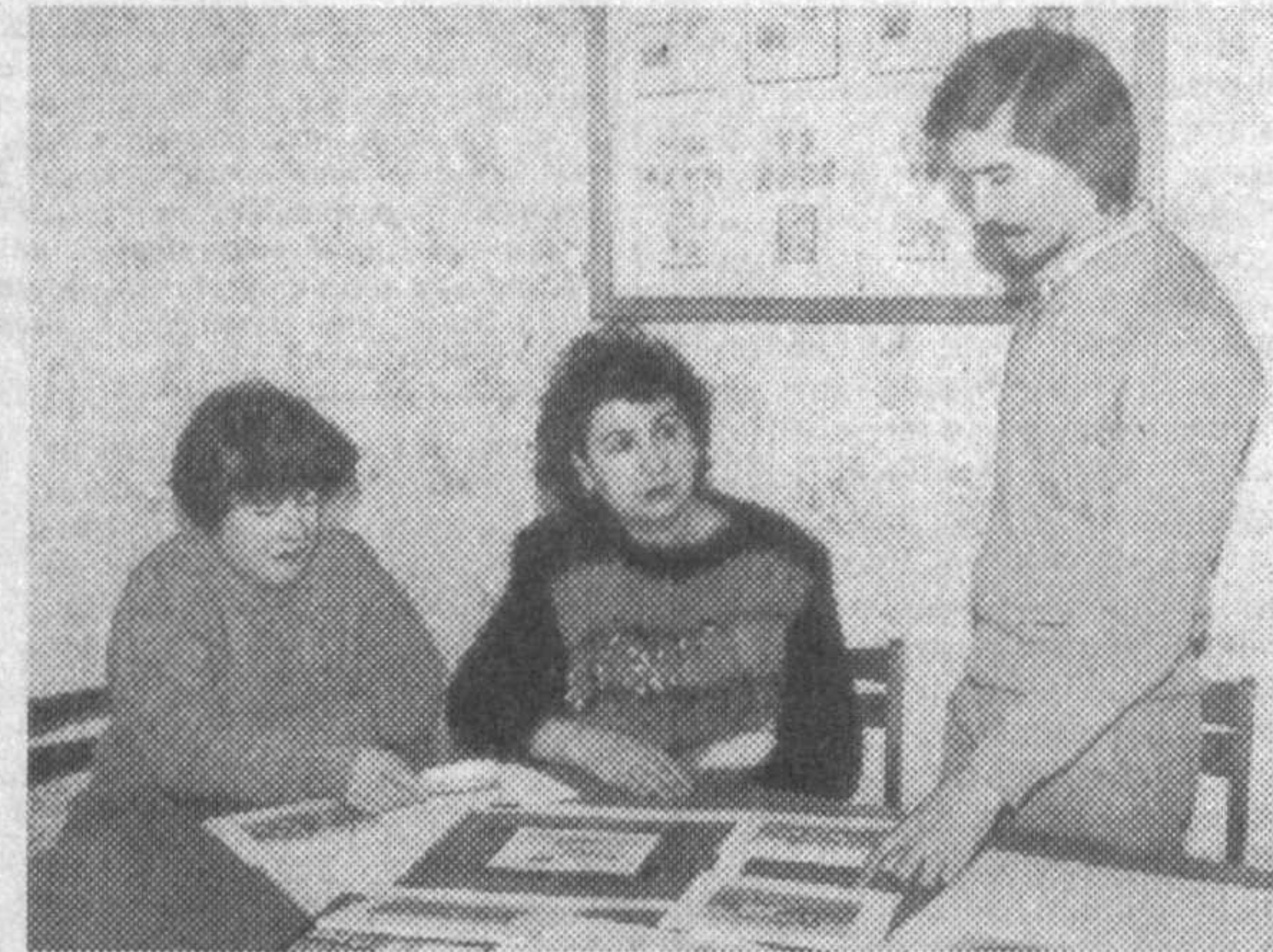
серией ведется совместно с МОК Республики Узбекистан. Диапазон работы довольно широкий, без творческого подхода все это не выполнимо.