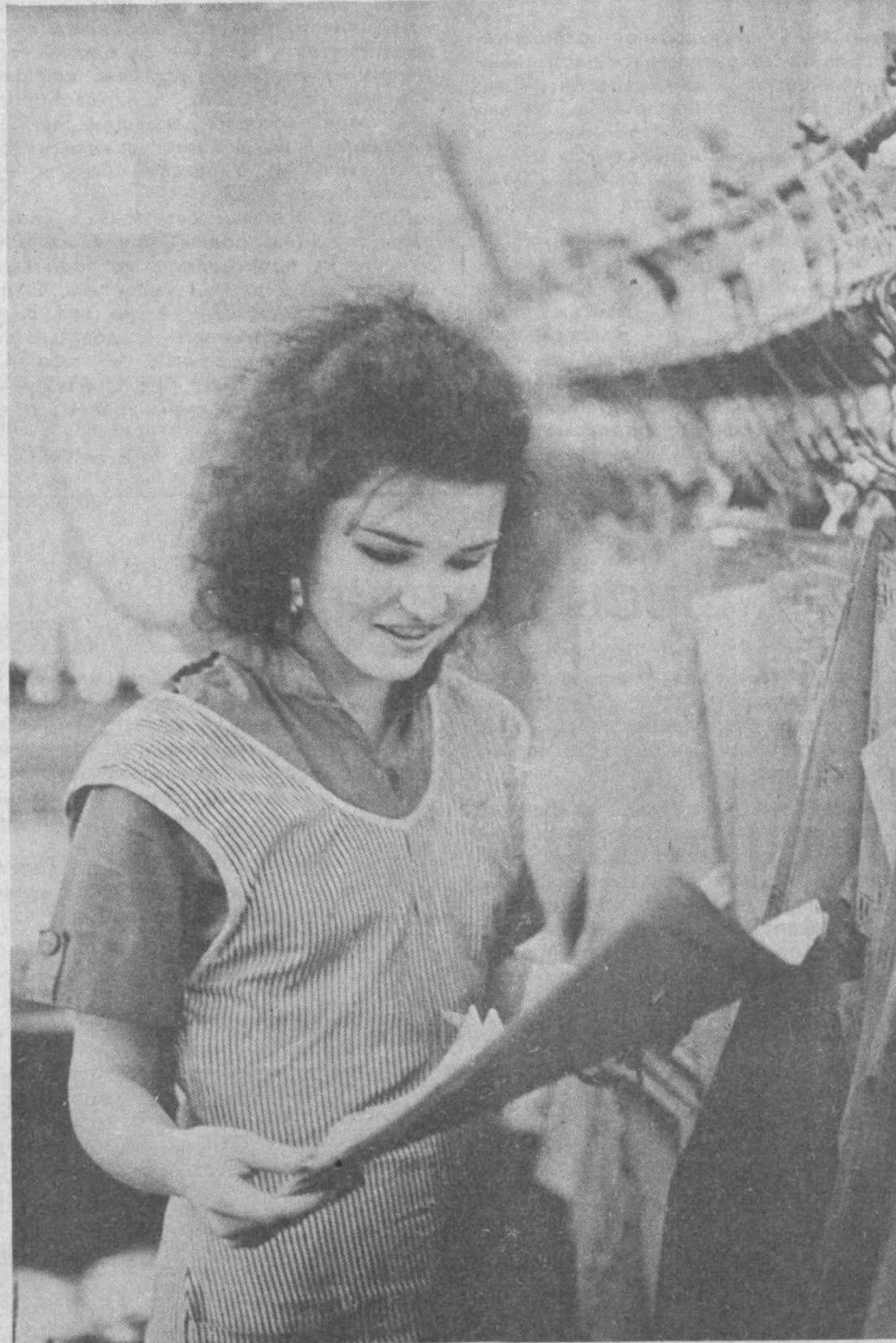
У ТАШКЕНТСКИХ ШВЕЙНИКОВ

МВД и КГБ Узбекской ССР, Прокуратуре республики и правоохранительным органам на транспорте совместно с другими министерствами, ведомствами, группами рабочего контроля поручено организовать постоянный и действенный контроль за продвижением импортных грузов, их доставкой до пунктов назначения и последующей передачей для реализации потребителям согласно установленному порядку. (УзТАГ).