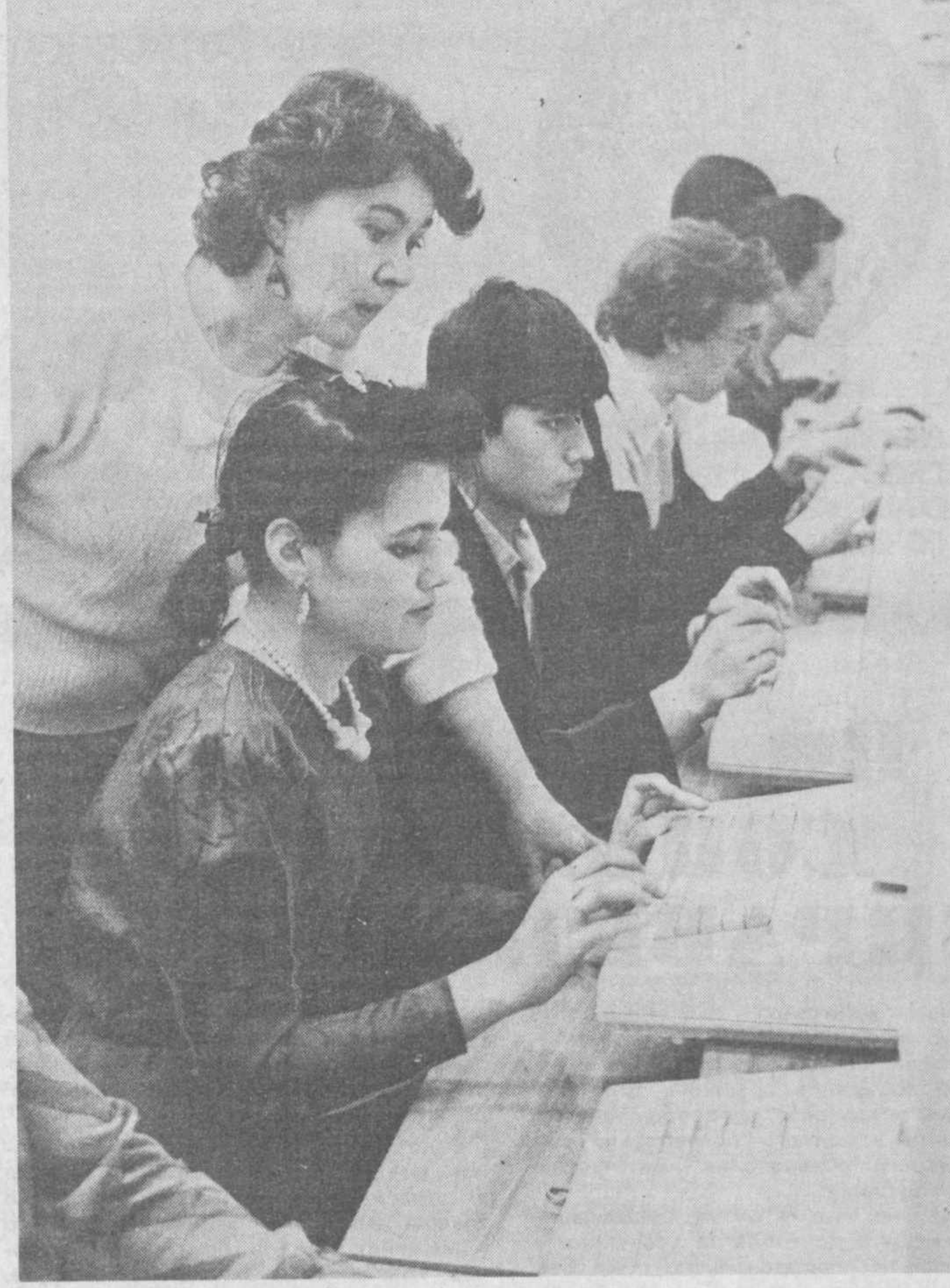
Школьник учится на менеджера

ТАШКЕНТ. Учебный класс по подготовке менеджеров создан в вечерней средней общеобразовательной школе № 37 Чиланзарского района Ташкента. Юноши и девушки учатся здесь по программе, рассчитанной на три года, и после окончания школы получают вместе с аттестатом зрелости свидетельство о прохождении специального курса. Это, конечно, не означает, что все они пойдут работать менеджерами — многое будет зависеть от индивидуальных способностей молодых людей. Но вне всяких сомнений, они станут более подготовленными к жизни, пройдут предметный курс, который в школе не изучают: как, например, подготовка к деловой жизни, основы маркетинга, сноровки чтения, аудиторного. Кроме русского и узбекского, овладеют английским и арабским языками. В любом случае выпускник сможет работать на компьютере и печатать на пишущей машинке, а это тоже даст ему больше