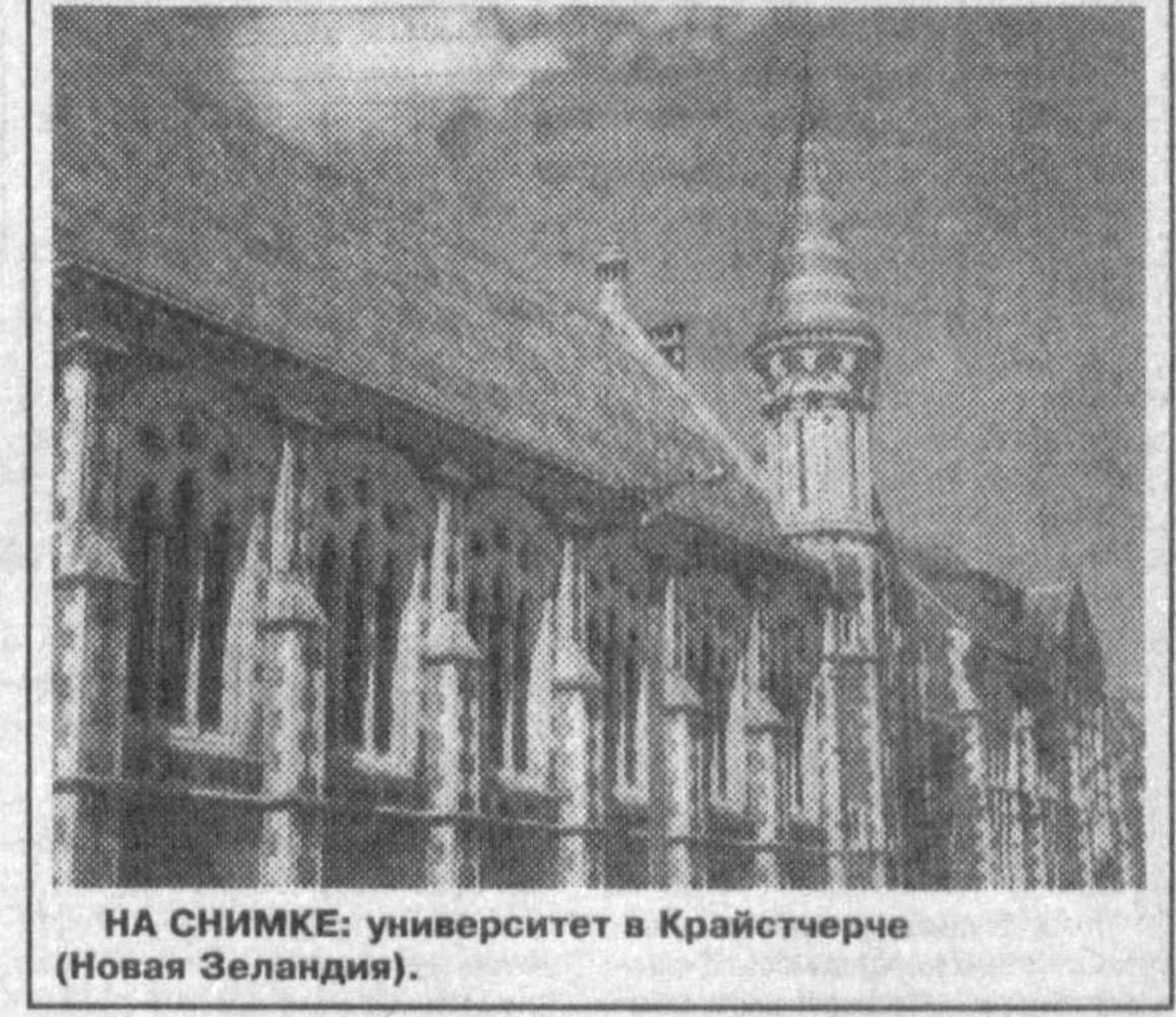
НА СНИМКЕ: университет в Крайстчерче (Новая Зеландия).