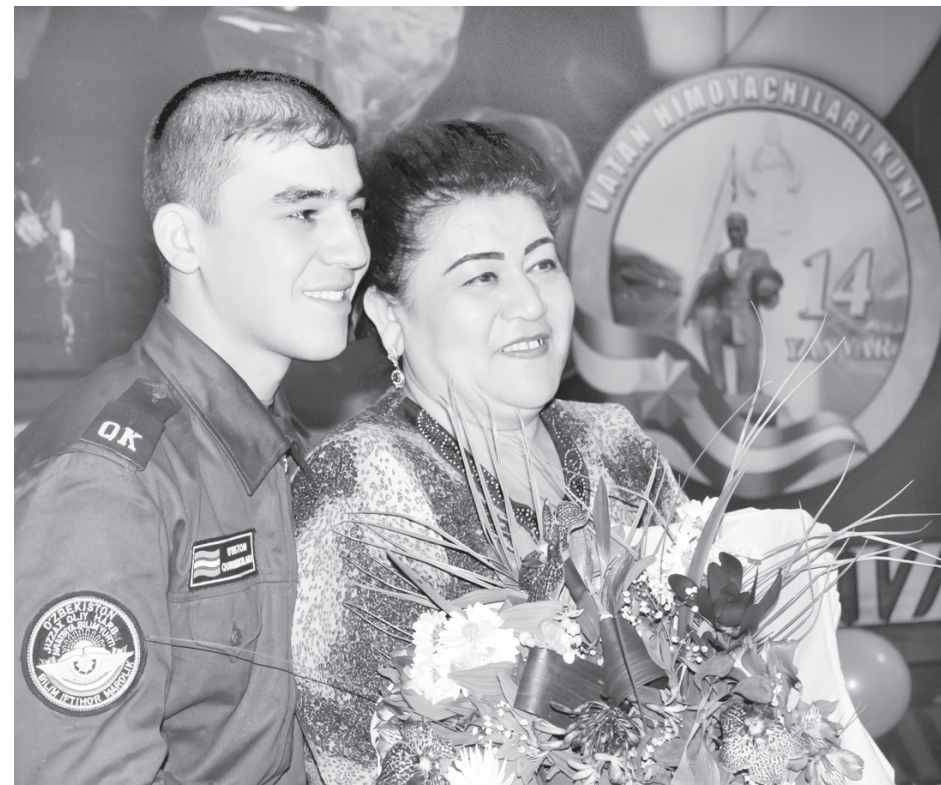
(Давоми. Бошланиши 1-бетда).

Бугунги кун ҳарбийлардан нафақат жисмоний тайёргарликка, балки юксак ақл-идрок, интеллектуал салоҳият, алоҳида руҳий-маънавий хусусият ва фазилатларга эга бўлишни, ахборот-коммуникация