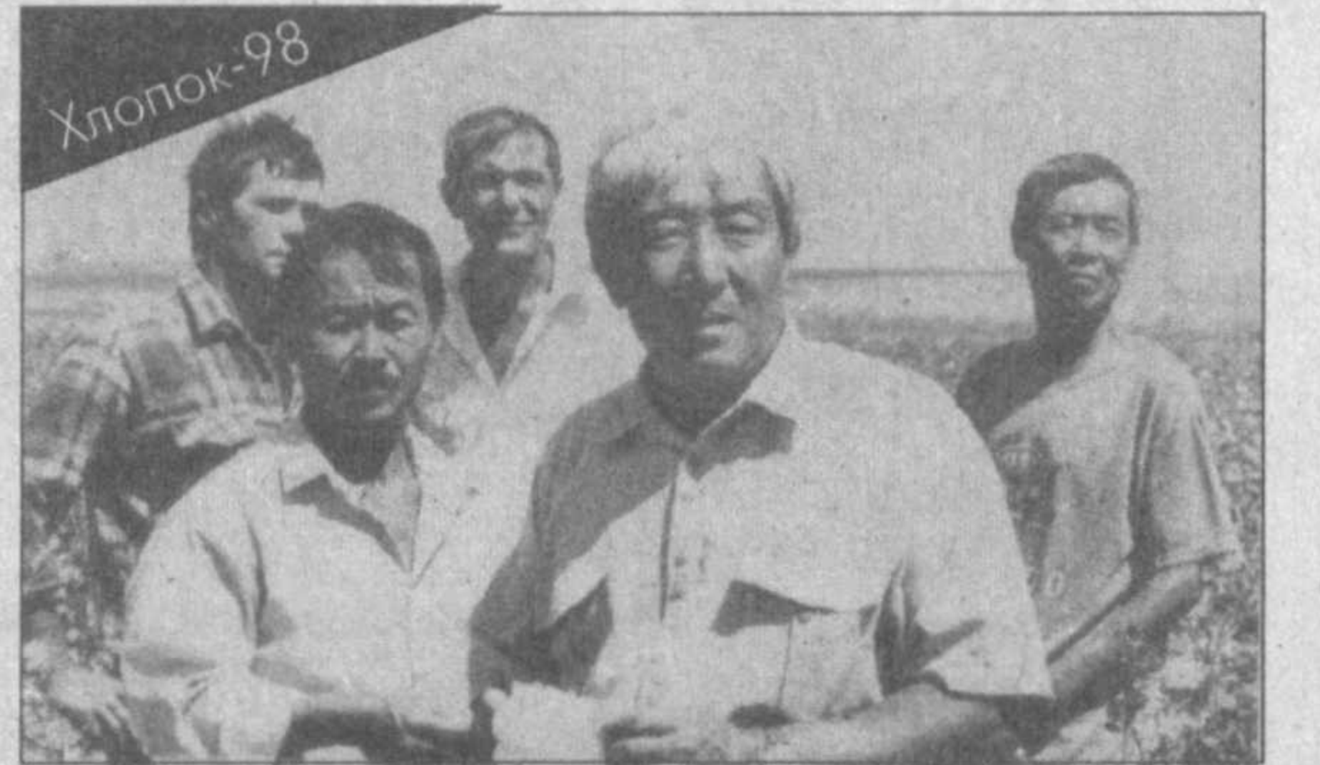
Одним из первых в Кашкадарьинской области в государственном заказе хлопководства фермерское хозяйство "Лева", что в Каршинском районе. На приемные пункты доставлено более 200 тонн ценного технического сырья. И это не предел, хлопка на полях еще много, земледельцы не снижают темпов страды.