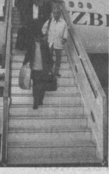
Youth Bureau" на отправку туристов в Узбекистан по летней программе чартерных рейсов. Открытие новой авиалинии укрепит сотрудничество двух государств, позволит нашим народам ближе узнать друг друга, глубже понять неповторимую, самобытную культуру двух стран, сотрудничать во имя гуманизма и прогресса.

После успешных переговоров, проведенных делегацией национальной авиакомпании "Узбекистан хаво йуллари" в Токио, нашим авиаторам предоставлено право совершать чартерные рейсы на регулярной основе по маршруту Ташкент — Нагоя — Ташкент. Первый рейс по этому маршруту на комфортабельном воздушном судне А-310 был успешно выполнен в эти дни. В столицу Узбекистана прилетели 188 японских туристов из разных городов Страны восходящего солнца с тем, чтобы воочию увидеть Самарканд, Бухару, Хиву, называемую "сердцем Великого шелкового пути", познакомиться с бессмертными памятниками архитектуры, узнать о традициях и обычаях нашего народа.