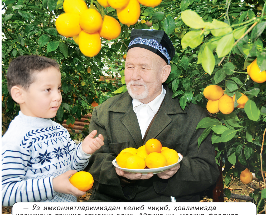
— Ўз имкониятларимиздан келиб чиқиб, ҳовлимизда иссиқхона ташкил этмоқчи эдик. Айтинг-чи, мазкур фаолият учун ҳам солиқ солинадими?