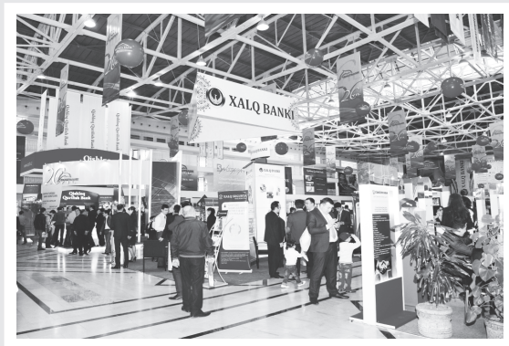
аҳоли ва тадбиркорлар мамлакатимиз банк тизимининг ютуқ ёки камчиликлари ҳақида ҳаққоний фикр билдираётдилар. Шу асосда таклифлар ишлаб чиқилиб, амалиётга татбиқ этилаётгани, ҳар бир ижтимоий сўровнинг натижалари матбуот нашрларида омма эътиборига ҳавола қилинаётгани эса банк-молия тизимда самарадорликни таъминлашда муҳим омил бўлаётир.

Мамлакатимиз иқтисодиётида рўй бераётган янгиланишлар, ҳар бир тармоқда қўлга киритилаётган ютуқлар, муҳими, аҳолининг турмуш фаровонлигини оширишда молия муассасаларининг салмоқли хиссаси бор. Гап шундаки, банклар томонидан кўрсатилаётган замонавий ва сифатли хизматлар, мижозлар учун имтиёзли шартлар асосида ажратилаётган маблағлар кўплаб истиқболли лойиҳаларни рўёбга чиқариш, минглаб янги иш ўринларини яратиш имконини бермоқда.