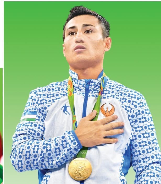
Медальный зачет: Бокс

нований и сборов за границей до новой системы поощрения атлетов и их наставников, создания уникальной системы медико-психологической поддержки. Предтечей олимпийского стал успех минувшего года, когда узбекистанцы с чемпионатов мира по разным дисциплинам возвратились с 15 медалями. Не прекращалась подготовка до августа 2016-го, когда пришло время держать бра- зильский экзамен.