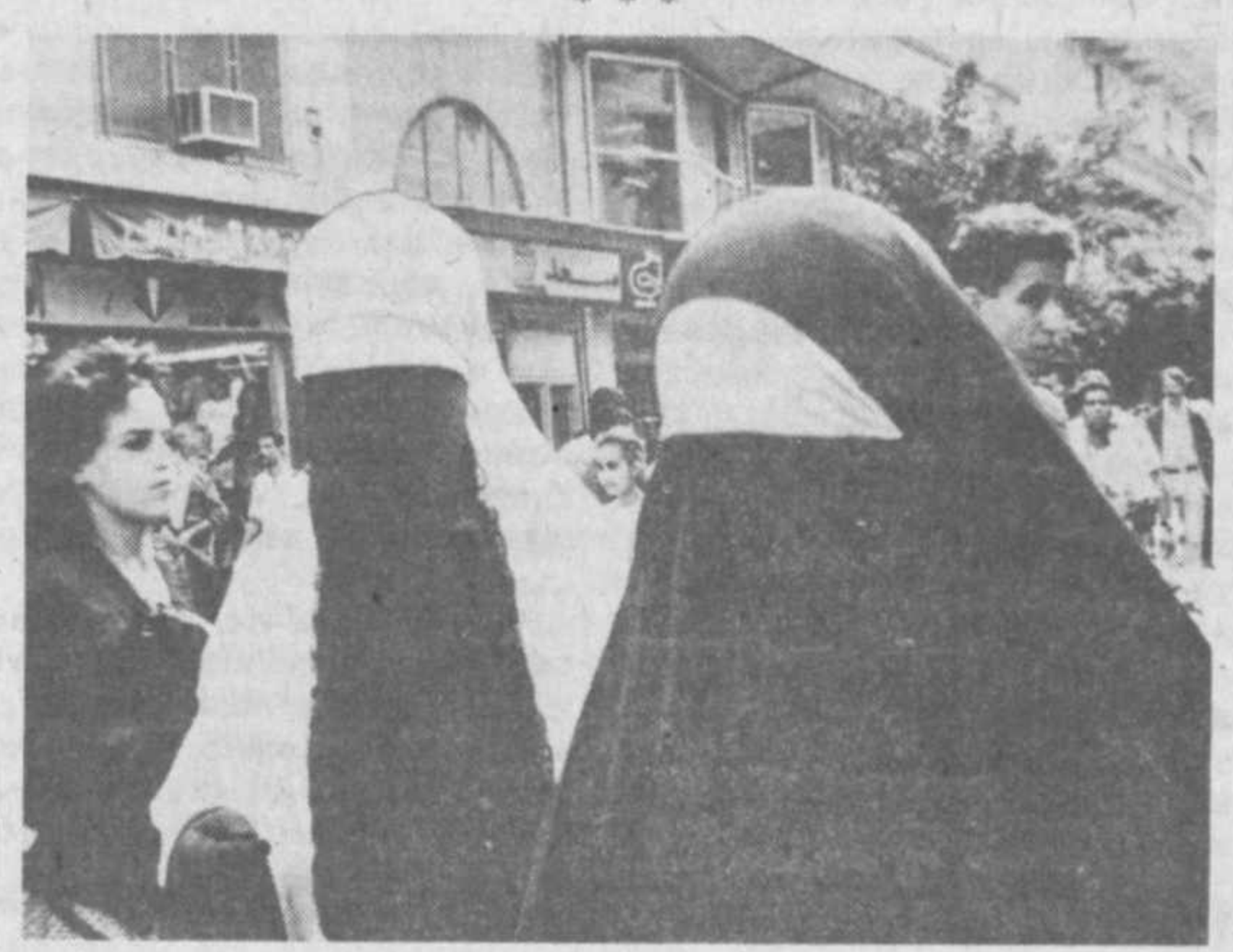
Женская эмансипация, изменившая лицо всего мира, совершенно не затронула страны Ближнего Востока. (По материалам печати)

По заявлению Ясира Арафата, вокруг палестинцев в странах Залива сложилась очень непростая ситуация. Особенно плохи дела в Кувейте. По его словам, из 430 тысяч палестинцев, проживающих в Кувейте, 110 тысяч подвержены репрессиям. Если положение не изменится к лучшему, между двумя народами может возникнуть кровавая месть. Истоки назревающего конфликта уходят корнями в недавнюю войну, когда многие палестинцы поддерживали режим Саадада Хусейна.