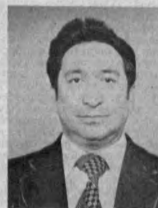
СССР Давлат банки Ўзбекистон жумҳурият банки бошқарувининг раиси Эркин Жўраевич БОКИМОВ

1948 йилда Тошкент шаҳри-да туғилган. Ўзбек. КПСС аъзо-си. Меҳнат фаолиятини Чкалов номидаги Тошкент самолётсо-злик заводиде йиғуви-слесар-ликдан бошлаган, бир вақт-нинг ўзида авиация технику-мида ўқиган. 1972 йилда Тош-кент давлат университетни ҳу-қуқшунослик факультетини та-момлагандан сўнг Тошкент ви-лоят прокуратураси судларида жинсий ишлар қараб чиқи-лиш устидан назорат бўлими прокурори вазифасида, 1973—1977 йилларда Ўзбекистон ССР прокуратурасида худди шундай лавозимда фаолият кўрсатган. Шундан сўнг Ўзе-бекистон ССР Адлия вазирилик судлов маҳкамалари бошқар-маси катта консультанти, бў-лими бошлиғи — бошқарма бошлиғининг ўринбосари, халқ депутатлари Тошкент вилоят кенгаши иқдорий комитети ад-лия бўлими бошлиғининг ўрин-босари, Тошкент вилояти суди аъзоси, Ўзбекистон ССР Олий суди аъзоси, 1987—1989 йил-ларда Андижон вилояти суди раиси бўлиб ишлаган. 1989 йилдан буйи Ўзбекистон ССР Олий суди раиси эди.