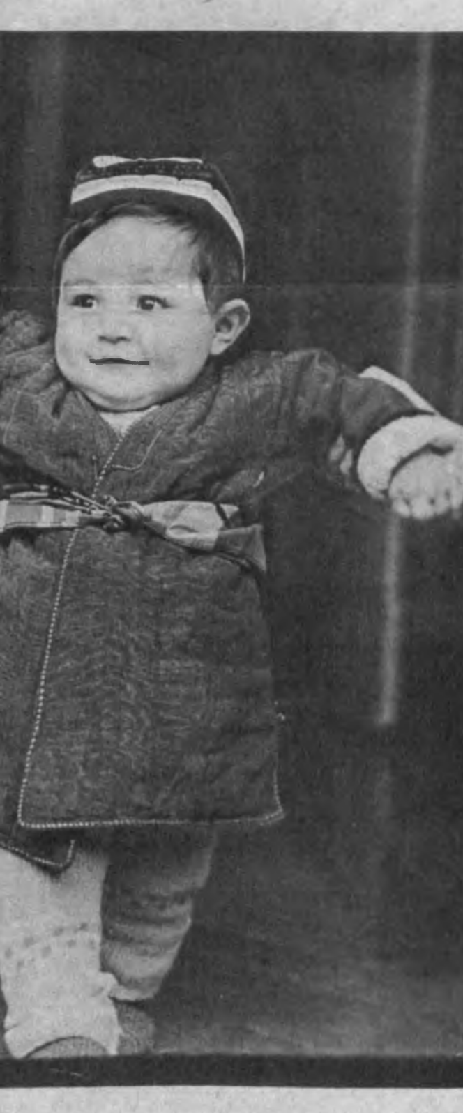
Қадамнинг дадил бўлиши, болажон!