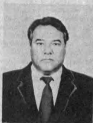
Ўзбекистон ССР қишлоқ хўжалиги вазири Мирзайон Яўлдошев ИСЛОМОВ

1936 йилда Фарғона вилоя-тининг Ўзбекистон райониде туғилган. Ўзбек. КПСС аъзо-си. Олий маълумотли — 1959 йил-да Тошкент қишлоқ хўжалиги институтини, 1971 йилда Тош-кент партия олий мактабини тугатган. Мутахассислиги буй-ича олим-агроном.