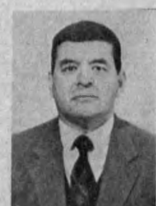
Ўзбекистон ССР молия вазири Эркин Абдулкатович МУРОДОВ

1990 йилдан эътиборан Ўз-бекистон ССР Олий Кенгаши план ва бюджет-молия масе-лалари комитетининг раиси. Ўзбекистон ССР халқ депу-тати. Медалъ билан мукофот-ланган.