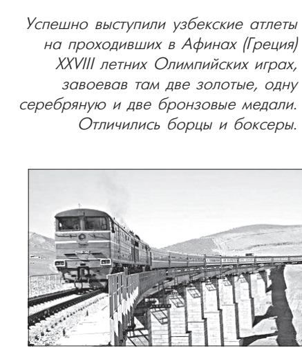
Сдана в эксплуатацию первая очередь железнодорожной магистрали Ташгузар — Байсун — Кумкурган и началось движение поездов между Ташгузаром и Дежканабатом протяженностью 57,7 километра.

Успешно выступили узбекские атлеты на прошедших в Афинах (Греция) XXVIII летних Олимпийских играх, завоевав там две золотые, одну серебряную и две бронзовые медали. Отличились борцы и боксеры.