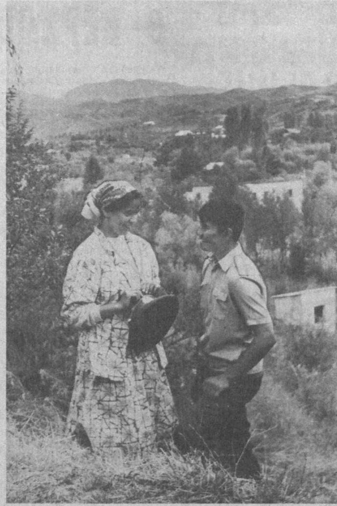
За околицей.