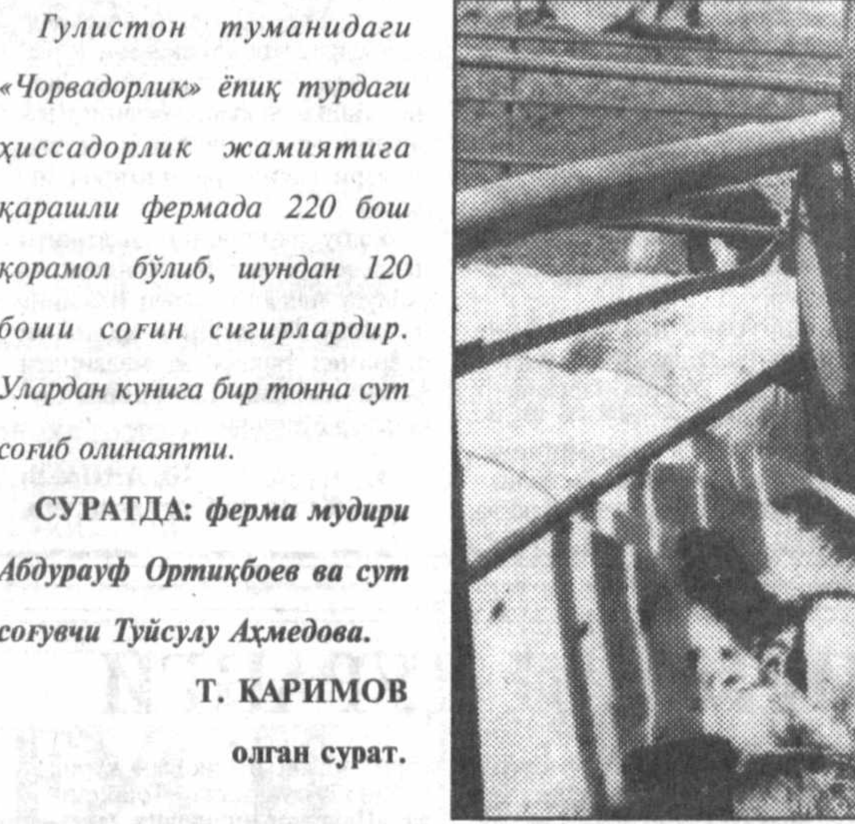
Улардан кунига бир тонна сўт соғиб олинайти.

СУЗА ЧИҚҚАНЛАР ВИЛОАТ далаларида мўл ҳосил тўпалаётгани, чигит пёнкасига остига экилган 70 миң гектар майдонда пахта қийғос очилётганини ташкилладилар.