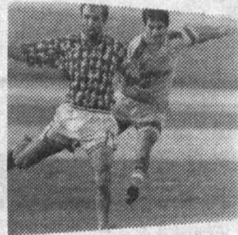
Футбол бўйича Ўзбекистон VI-чемпионатининг 20-тур учрашувларида ўзига хос натижалар қайл қилиниб, дарвозаларга 36 тўп киритилди. Ушбу турнинг энг қизиқарли уйини Наманганда бўлиб ўтди. Пешқадам

МХСК (Тошкент) «Навбахор»нинг меҳмони сифатида майдонга тушди. Шунинг элоҳидида таъкидлаш лозимки, армиячилар йил ҳисобидан биринчи марта мана шу мусобақада икки очко йўқотишга мажбур бўлишди. «Навбахор» тошкентлик рақибларининг ғолибона юрншларини тўқитиб, ўз очколарини яна биттага қўлайтирди. Наманганликлар ўтган йилги мусобақалар давомида ҳам мамлакатнинг тўрт карра чемпиони «Нефтчи»ни доғда қолдириб, олтин медални қўлга киритганди. Олтинчи мавсумдаги уларнинг энг катта ютуғи шундан иборат бўлдики, МХСКдан маълумиятга урчаган 16 командага «ғолибни синдириш» қанақа бўлишини ҳамда Ўзбекистон чемпионатига очко йўқотмайдиган бирорта ҳам футбол клуби йўқлигини исбот эпти. Икки кучли команданинг учрашуви 2:2 ҳисоби билан тугаган бўлса-да, МХСК учун дуранг ва маълумият йўли очилди.