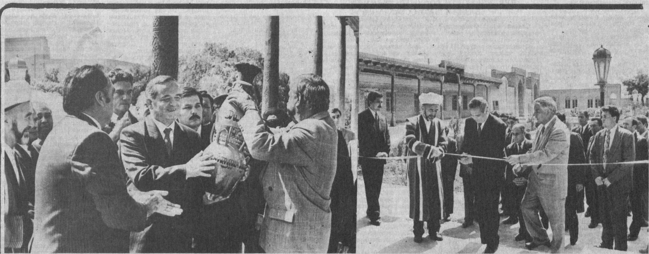
В этом году во всем мусульманском мире широко отмечается 675-летие Бахоуддина Накшбанди. В древней Бухаре, где