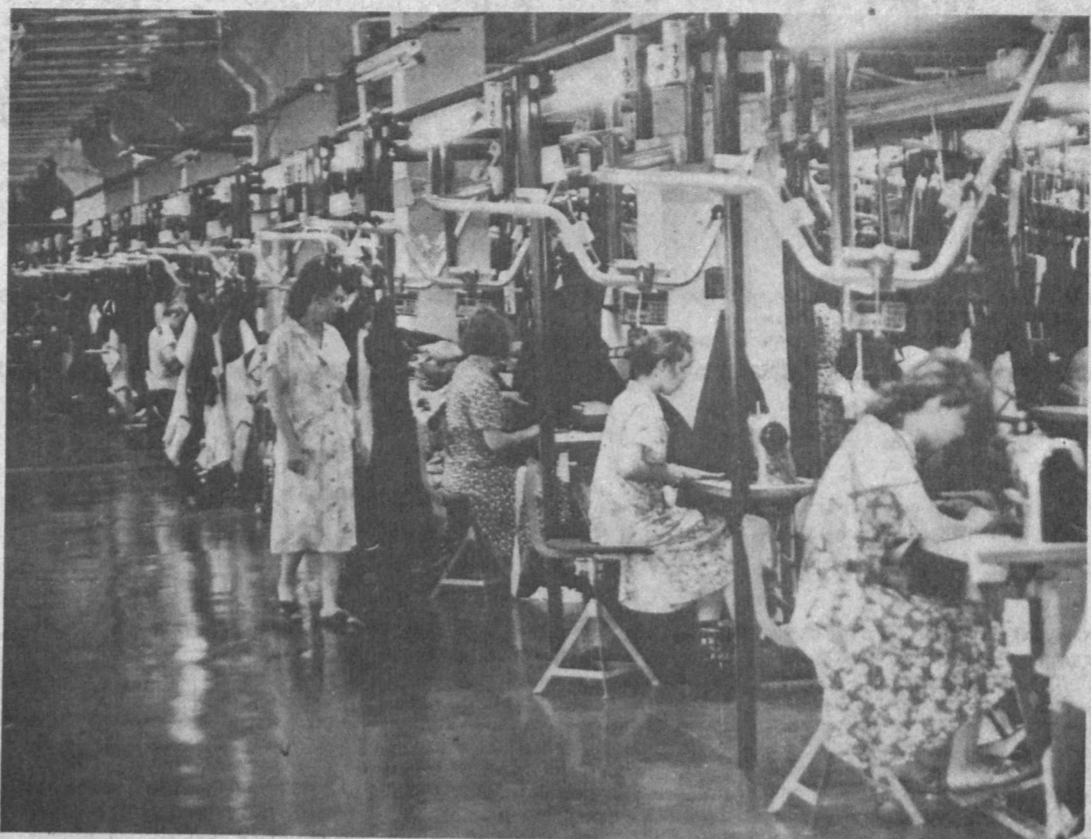
На потоке модное пальто.

готовит базовое профессионально-техническое училище.