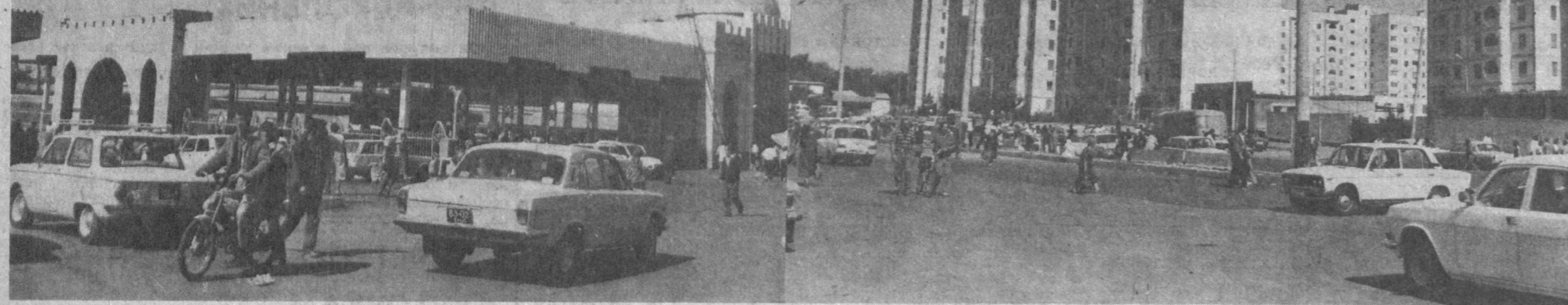
С каждым годом хорошеют города и поселки республики. Возводятся объекты соцкультбыта, жилые дома, разбиваются новые скверы и парки. Немало их было построено и ре-