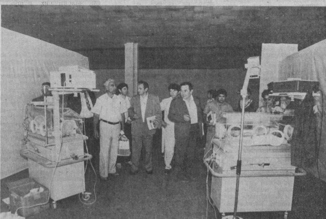
В Самарканде состоялась Вторая всемирная конференция по всеобщему здоровью. Участники конференции — специалисты по неонатологии, акушерству, стоматологии, по экстренной медицине из стран СНГ, США, Германии, Швейцарии, Японии, Франции, Канады, Аргентины.