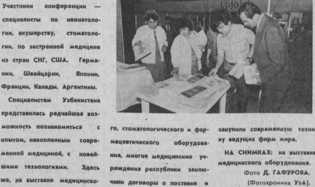
Специалистам Узбекистана представлялась редчайшая возможность познакомиться с опытом, накопленным современной медициной, с новейшими технологиями. Здесь же, на выставке медицинско-

го, стоматологического и фармацевтического оборудования, многие медицинские учреждения республики заключили договоры о поставке и закупили современную технику ведущих фирм мира. НА СНИМКАХ: на выставке медицинского оборудования.