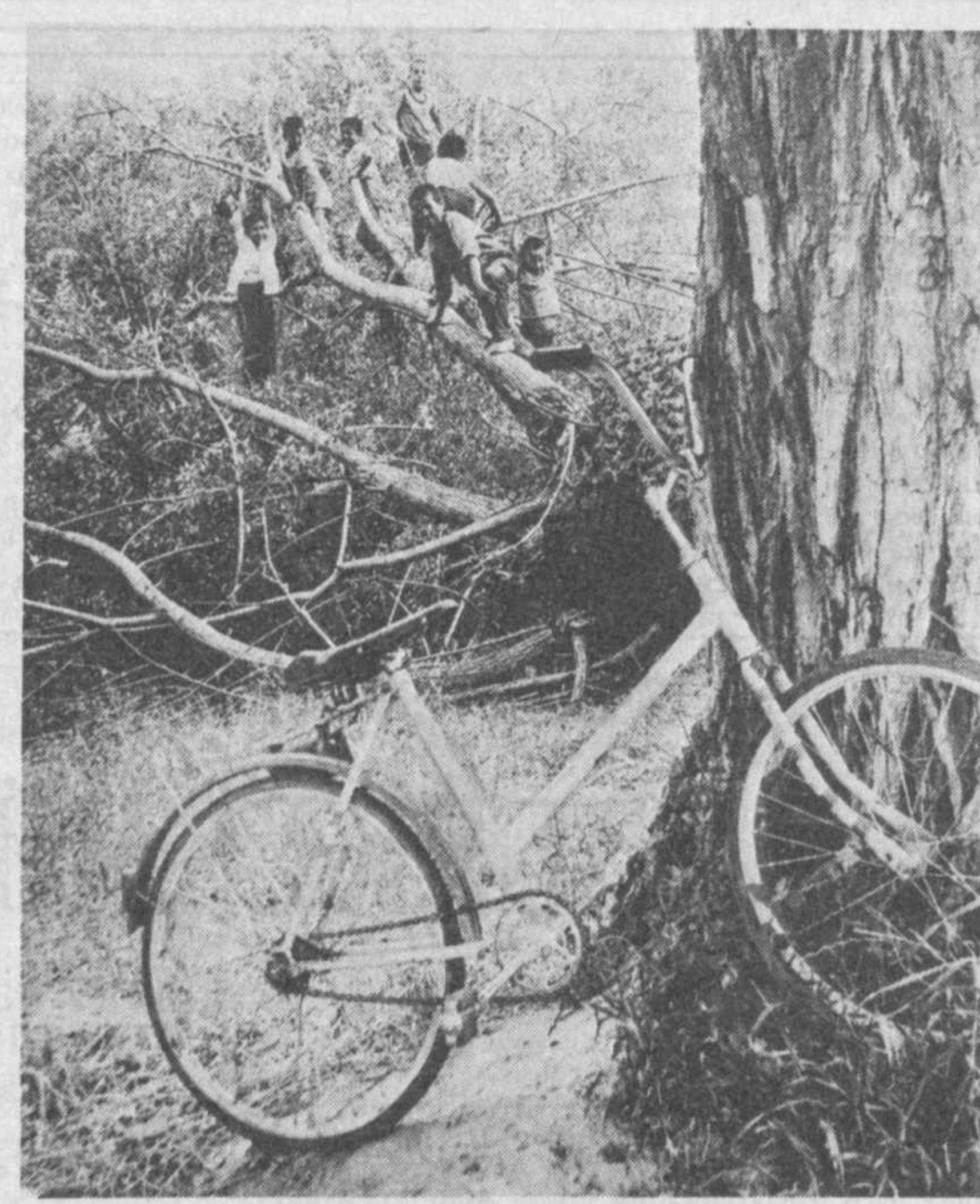
Велосипед нас подождет...