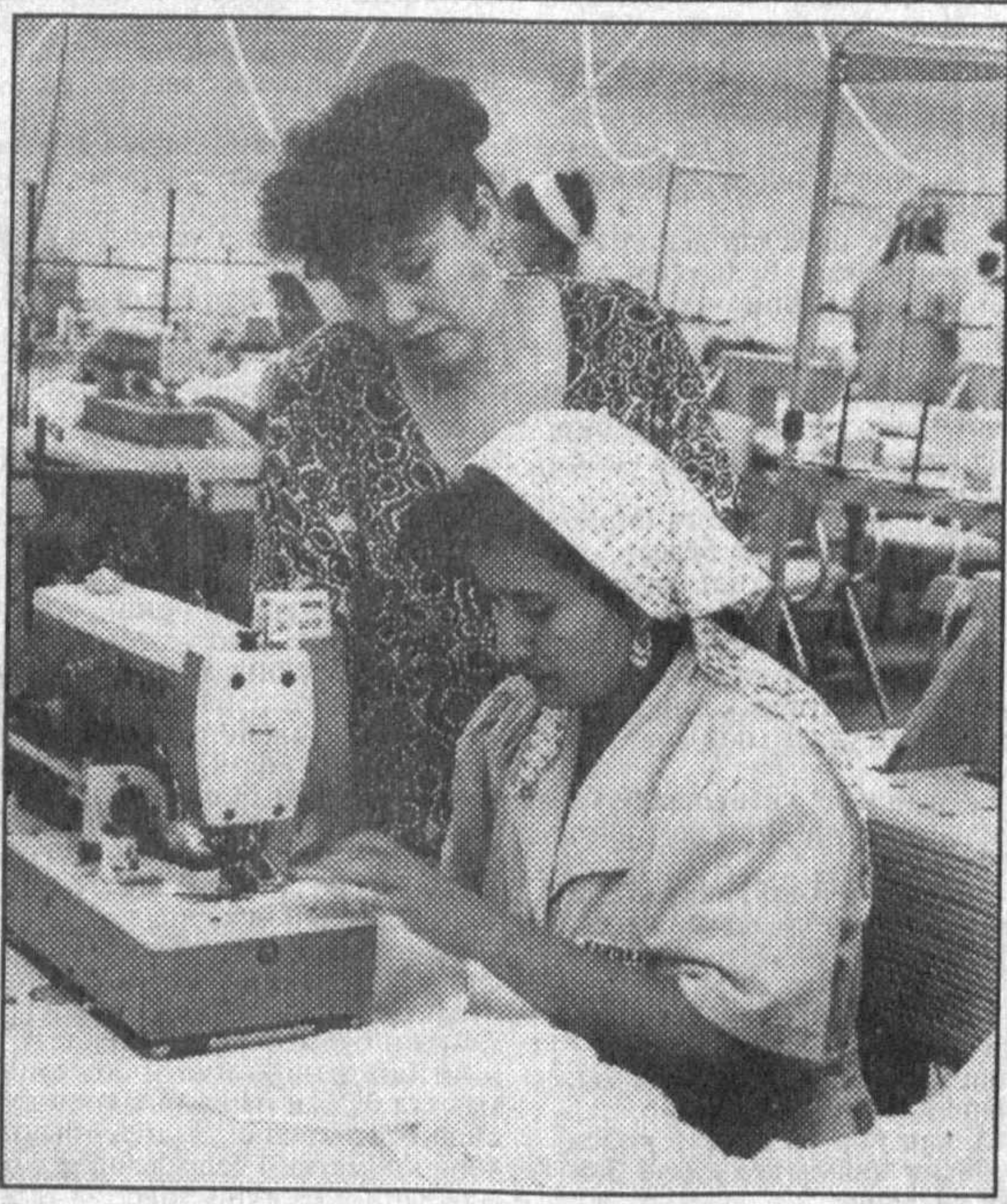
Қашқадарь вилоятидаги энг йирик sanoat корхоналаридан бири «Қаштекс» оиш ҳиссадорлик жамияти иш бошлаганига ҳали кўп вақт бўгани йўқ. Шунга қарамай, бу ерда ишлаб чиқарилаётган маҳсулотлар истеъмолчилар орасида анча шўхрат топиб улгурди.