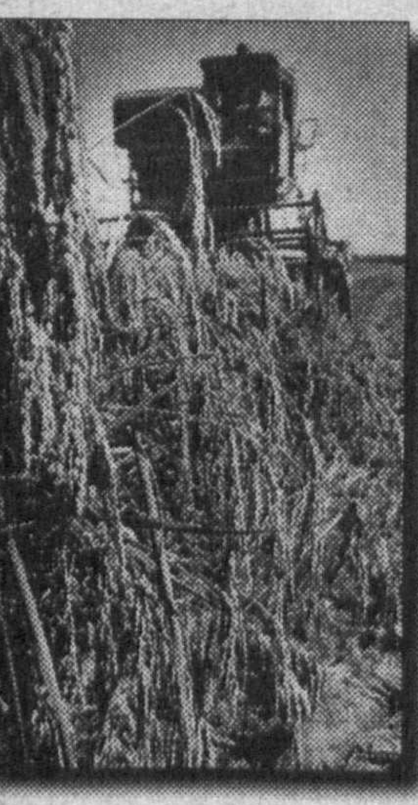
Шолчилик бўйича «Хоразм тажрибаси»нинг ана бир ибратли кирраси ҳам мавжудки, у кум-сахро шариотиди ҳосил етиштиришни кўзда тутди. Бунинг ажабланидиган жойи йўқ. Воҳада ер захиралари ниҳоятда чекланган. Аҳоли эса тез кўпаймоқда. Ута сувталаб экин — шолини Қорақум бағри ва этакларидан ўзлаштирилган янги ерларда ўстириш тажрибаси 20 йилча муқаддам ҳаётини ана шу талаб-тахозоси билан туғилганди. Орадан ҳеч канча вақт ўтмай, бу тажриба бутун вилоятга ёйилди. Ҳозир вилоят бўйича етиштирилаётган шולי ҳосилининг 25 фоизидан зиёдини собиқ кум-сахролар ўрнида таркиб топган иқтисодлашган дончилик хўжаликларини берапти.

Хоразмда ҳосилдорлик ва самарадорликни оширишга қаратилган бошқа ибратли тажрибалар ҳам кўп. Мана, икки йилдирик, вилоятда шолини кўчатилаб экиш тажрибаси қўлланилапти. Бунинг ибратли жиҳати шунки, май ойининг охиридаги махсус кўчатилаб ундирилган ниҳоллар июнь ойининг охири ва июлнинг бошларида бугдойи ёки бошқа эртапишар экинлари йиғиб-териб олинган далаларга кўчириб ўтказилади. Натижада вақтдан ютилади, бугдойи об-ҳаво ва бошқа сабабларга кўра анча кеч ўриб олинса-да, кўчатилабдаларда ривожланган ҳолда кўчириб ўтказилган шולי кўзда эрта етилади, ҳосил мўл ва сифатли бўлади. Ўзбекистон Қаҳрамони Машириф Қувов раҳбарлик қилаётган Богот туманидаги «Богот» жамоа хўжалиги шолкорлари бу серсамара тажрибани ўтган йили вилоятда биринчи бўлиб қўлаган эдилар. Дастлабки йили 10, ушбу йил эса 55 гектар майдонга кўчатилаб шולי экилди. Олди далалар гектарига 50 центнергача ҳосил берган бўлса, кўчатилаб экилган майдонларнинг ҳар гектаридан 60 центнергача шולי йиғиб олинди. Мазкур хўжалик далаларида шолини ўзи кўчатилаб экидиган дастлабки машиналар пайдо бўлди. Республикаимиз Президенти Ислам Каримов яқинда мазкур