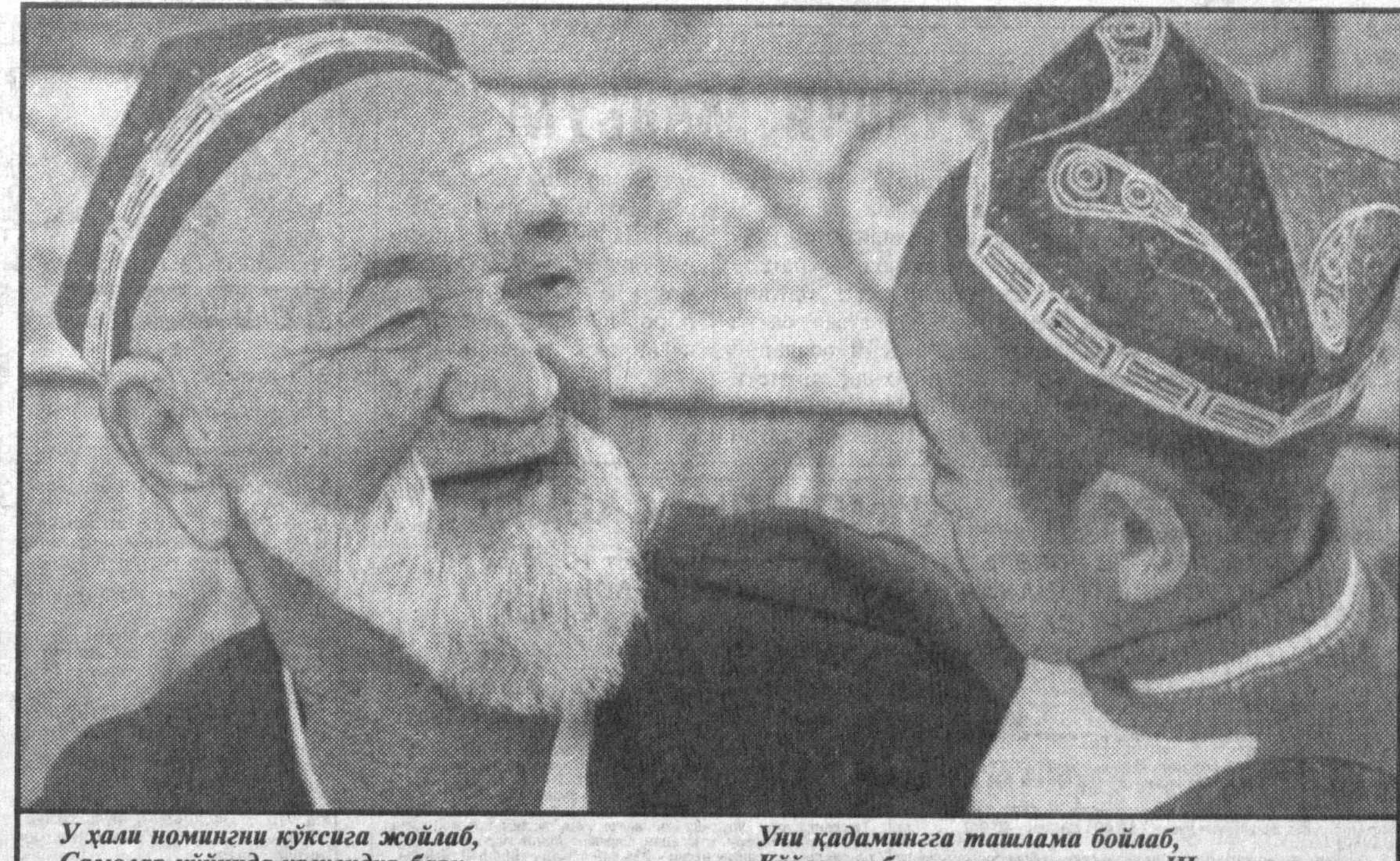
У ҳали номингни кўксига жойлаб, Самарлар қўйида ургусидир барқ.

Сўхбатимиз Амир Темур ва Гагарин кўчалари кесишган чорраҳадаги уй олдига бўла-