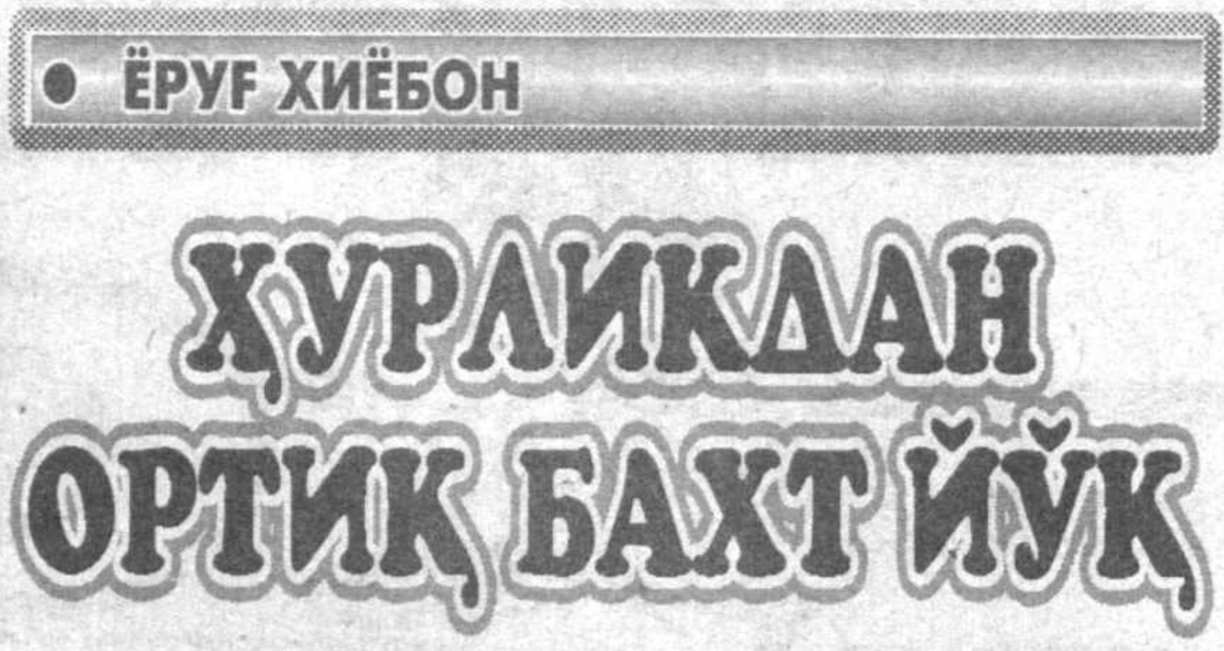
• ӨРУҒ ХИБЁН

рхларда жаҳон бозорига экспорт қилаётган экансиз. Холбуки, бу пайтда Россия фабрикалари хомашё йўқлигидан ишламай, тўхтаб қолган. Улар хомашё йўқлиги туғайли ҳозир ҳам тўхтаб турибди. Сизлар бизнинг биржамиз орқали сотиб олаётган пахта корхоналарга етиб бормаспти. Воситачилар уни бошқа воситачиларга сотмоқда. Сизларда нима-лар бўлаётганини ўзингиз аниқлаб олаверинглар.