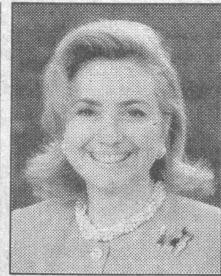
ларни ўрганиш ишига содиқ қолди.

Бугун Ўзбекистонга Хиллари Ролэм Клинтон -- Америка Қўшма Штатлари Президенти Уильям Жефферсон Клинтоннинг рафиқаси ташриф бюоради.