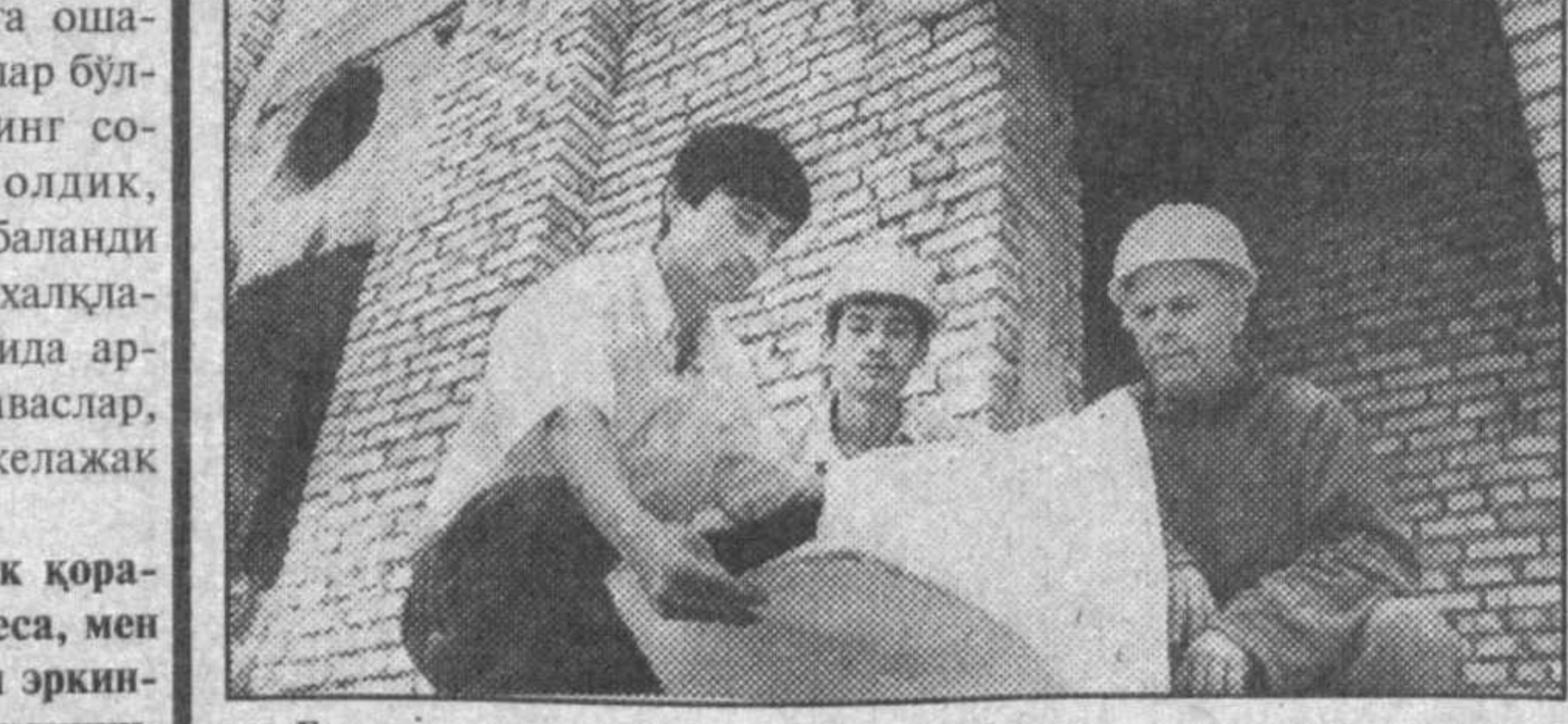
Бир-икки... у... тўрт... истиқлол юрти иморатлари, улкан-улкан билонлар гўшлари кўндалмоқда. Кунба-кун катта-катта билонлар қад ростланаяпти. Ўрнатлаб ишега кетаяпти кўнгалми армияча тикалган иморатга тушади... Кечкурун қайтаётди эса... не кўз билан кўришса, унинг биришиги бир баҳа қолган бўлади... Бу ободчилик, қўрқалмак йилларини аваж олаётганидан ишора.