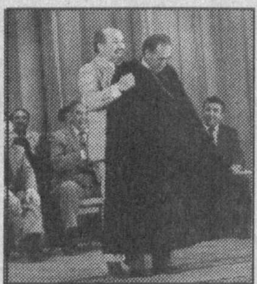
Хамзатовнинг авар шоири эканлигини...